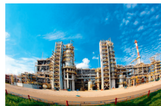
ОАО «Газпром нефтехим Салават».

Процесс изомеризации позволит компании обеспечить выпуск изомеризата – высокооктанового компонента смешения с высоким давлением насыщенных паров для получения товарного бензина, отвечающего требованиям технического регламента. Высокооктановый компонент собственного производства даст возможность увеличить выпуск бензинов высокого экологического класса – Евро-4 и Евро-5 (на сегодняшний день компания получает высокооктановый