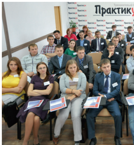
Во время научно-практической конференции молодых специалистов Общества

На заседании принята и утверждена Резолюция Координационного совета молодежного объединения – документ, который придает вектор направления деятельности молодежного объединения на 2014 – 2015 годы. Документ представлен на рассмотрение руководству ООО «Газпром переработка», Объединенной и первичным профсоюзным организациям. Резолюция содержит предложения инициативной молодежи Общества о реализации Концепции молодежной политики межрегиональной профсоюзной организации ОАО «Газпром». Прежде всего, это предложения по объединению интеллектуального потенциала молодежи, созданию благоприятных условий для успешной социализации, эффективной самореализации и включению различных категорий работающих молодежи ООО «Газпром переработка» в процессы научно-технической, социально-экономической, общественно-политической,