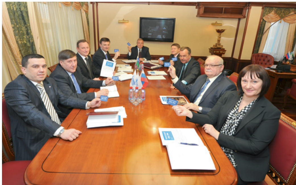
Руководители ООО «Газпром переработка» в числе первых получили дисконтные карты

– Важно отметить, что в этот процесс мы вовлекли всех членов первичных профсоюзных организаций ООО «Газпром переработка», которые трудятся на объектах, расположенных в г. Сургуте и Сургут-