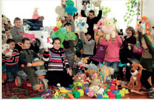
И много, много радости деткам принесли.

он с благотворительной помощью, устроив настоящий праздник для детишек поселка Приуральский.