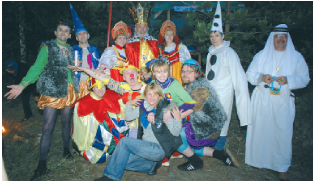
Все могут короли! На фото Мадест XVI и другие участники ночного карнавала

Ну а в полночь начался настоящий карнавал! Яркое костюмированное представление с королем острова Черный Мадестом XVI «Живородящим», казаками, сундуком, наполненным золотыми слитками, и боевой пушкой помог воплотить в жизнь сценарист Андрей Соболев. По