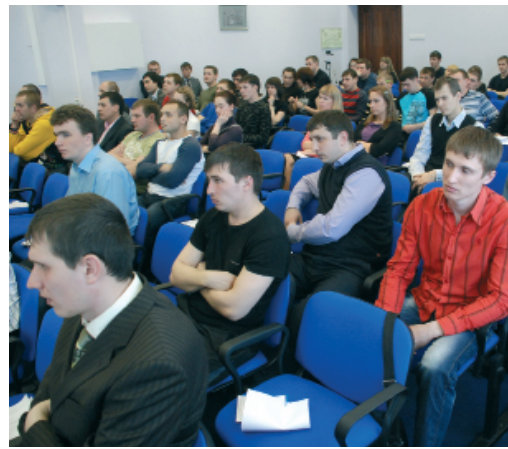
Участники встречи со специалистами завода

Согласно утвержденному плану мероприятий по организации работы с молодежью, более половины ее представителей стали участниками встреч со специалистами завода, которые рассказали о деятельности предприятия. Молодежной аудитории был представлен видеоролик соответствующей тематики, а также краткие информационные сообщения на темы: «Структура предприятия, заработная плата и социальные гарантии работников», «Основные технологические установки Сургутского ЗСК», «Охрана труда и промышленная безопасность», а также «Формирование экономических показателей завода», «Система менеджмента качества» и др. Докладчики – руководители подразделений и инженерно-технические работники завода – преподнесли материал профессионально и доступно для восприятия, продемонстрировав заинтересованность в привлечении молодежной аудитории к жизни завода.