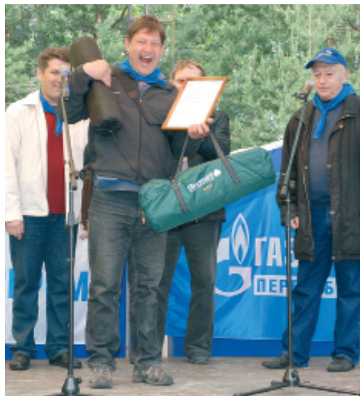
Это сладкое слово «победа»!

Организаторы выражают отдельную благодарность за оказание содействия в проведении фестиваля коллективу ООО «Газпром трансгаз Сургут», в частности подразделениям ЭУ «Сургутэнергогаз» и ЦКиД «Камертон».