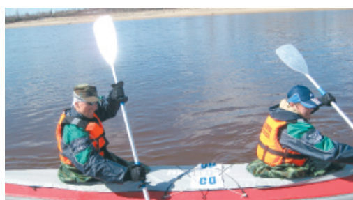
Байдарка под номером шесть в погоне за победой