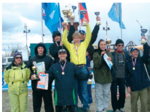
На пьедестале почета

Наша байдарка стартовала под номером шесть. Первой задачей было догнать стартовавшие впереди команды и выбрать оптимальную скорость прохождения дистанции. Сделать это нам удалось, но не без труда. В течение полутора часов наша команда возглавляла марафон, пока к нам не подтянулся экипаж «Шевера» – ежегодные победители и рекордсмены «ЯХА-