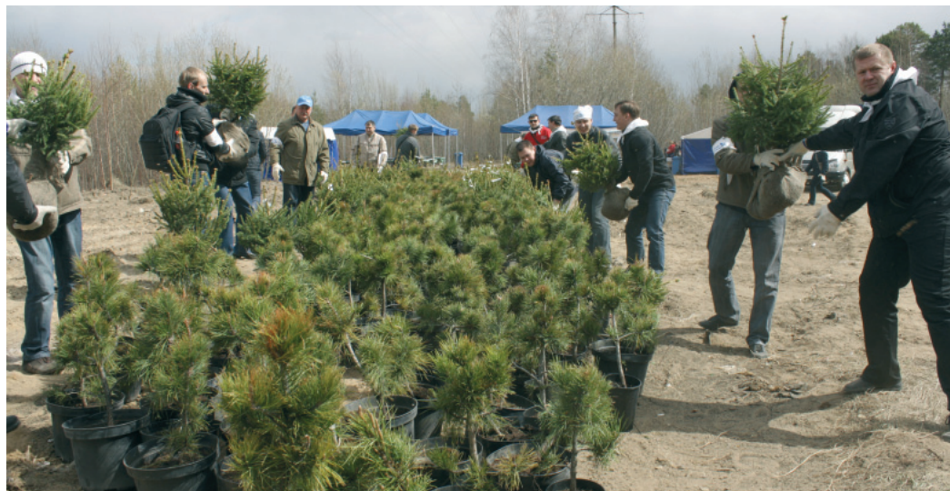
Сотрудники администрации Общества высадили 400 деревьев.

13 мая сотрудники администрации ООО «Газпром переработка» вышли на субботник, в рамках которого провели санитарную уборку территории и начали работу по обустройству парка имени Игоря Киртбая в поселке Лунном города Сургута. Было высажено по 200 деревьев кедра и ели, приобретенных Объединенной профсоюзной организацией ООО «Газпром переработка».