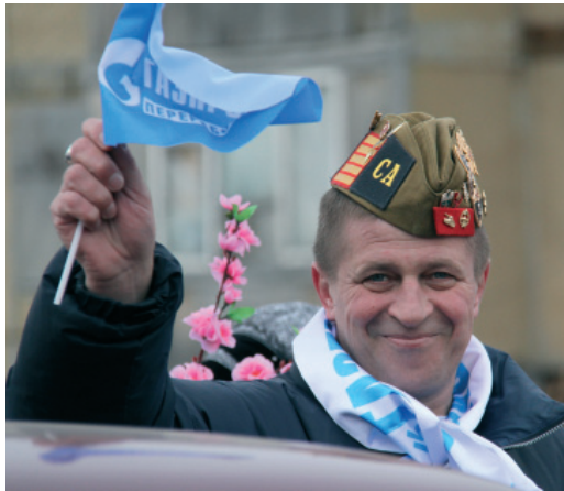
Более 300 заводчан 9 Мая прошли по главной улице Нового Уренгоя – Ленинградскому проспекту.

С каждым днем все дальше в прошлое уходят годы страшной и кровопролитной войны 1941-1945 гг. Невозможно передать словами бесконечную признательность ветеранам, отстоявшим свободу и независимость нашей Родины. Но она живет в наших сердцах, и каждый год мы с великой радостью и невероятной грустью идем маршем Победы, смыкая свои ряды в колоннах праздничного шествия.