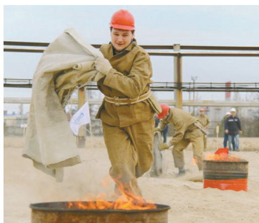
Этапы и правила соревнований из года в год остаются неизменными, однако для участников это все равно серьезный экзамен.