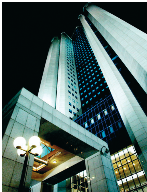
По традиции годовое Общее собрание акционеров ОАО «Газпром» пройдет в Москве в главном офисе компании.

установленном внутренними документами Общества;