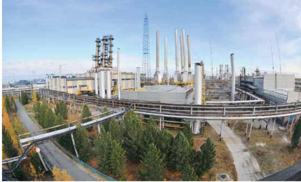
Технологический комплекс ЗПКТ

ЗАВОД ПО ПОДГОТОВКЕ КОНДЕНСАТА К ТРАНСПОРТУ ОТМЕЧАЕТ ЮБИЛЕЙ