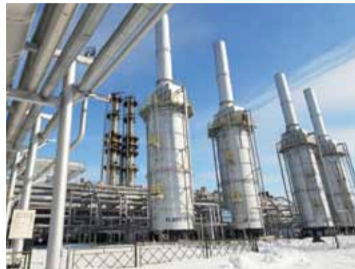
Трубчатые печи установки дезанизации конденсата