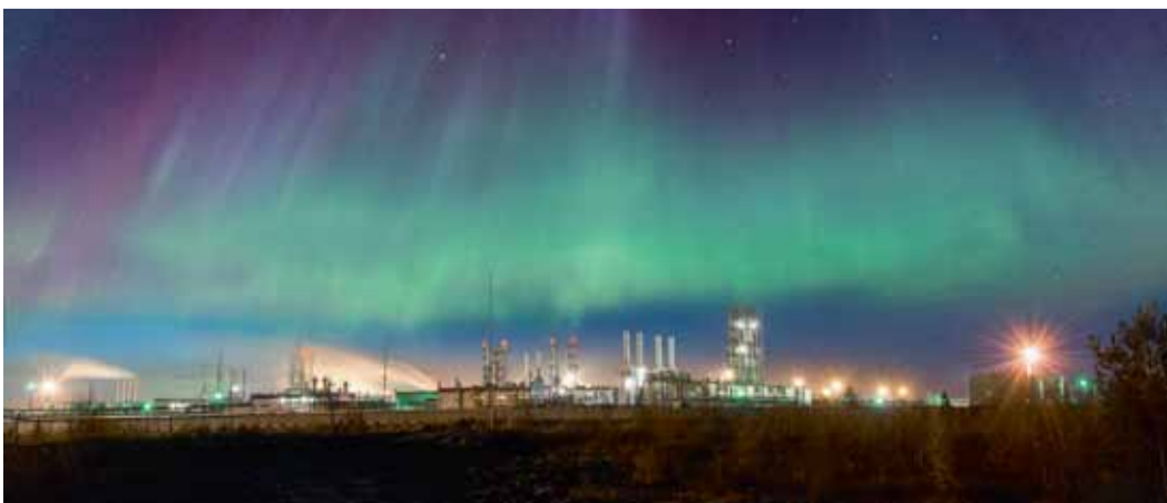
Северное сияние на ЗПКТ

– Наш завод является единственным предприятием ОАО «Газпром» перерабатывающего профиля в ЯНАО, которое обеспечивает не только подготовку к транспорту сырья на Сургутский ЗСК. Производственный процесс добычи газа в регионе и производственный комплекс переработки газового конденсата на ЗПКТ – взаимосвязанная технологическая цепочка, где завод является важнейшим звеном. Это красноречиво подтверждается географией поставщиков углеводородного сырья. В настоящее время на завод поступает нестабильный газовый конденсат неокотских залежей Уренгойского, Ямбургского, Северо-Уренгойского, Ен-Яхинского НГКМ. С июля 2008 года от ЗАО «Ачимгаз» на установку дезанизации конденсата № 1 стал поступать нестабильный конденсат ачимовских залежей Уренгойского НГКМ. Этот конденсат отличается большим содержанием тугоплавких высокомолекулярных парафинов, но от этого он не менее ценный. С 2009 года организована подача на УДК-1 ачимовского конденсата с еще одного технологического объекта Уренгойского НГКМ – УКПГ-22 ООО «Газпром добыча Уренгой». Принимая во внимание продуктивность и объемы залегающих запасов углеводородов ачимовских пластов, именно этот конденсат является основным сырьем на долгосрочную перспективу