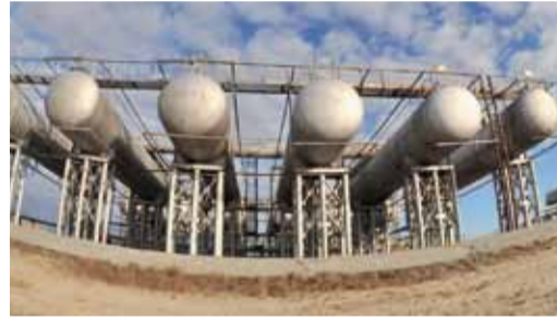
Буллиты головной насосной станции