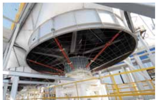
Аппараты воздушного охлаждения установки получения пропан-бутана

для технологических установок ЗПКТ, как и газовый конденсат с неокотских залежей Заполярного НГКМ, освоение которых с 2011 года обеспечивает ООО «Газпром добыча Ямбург».