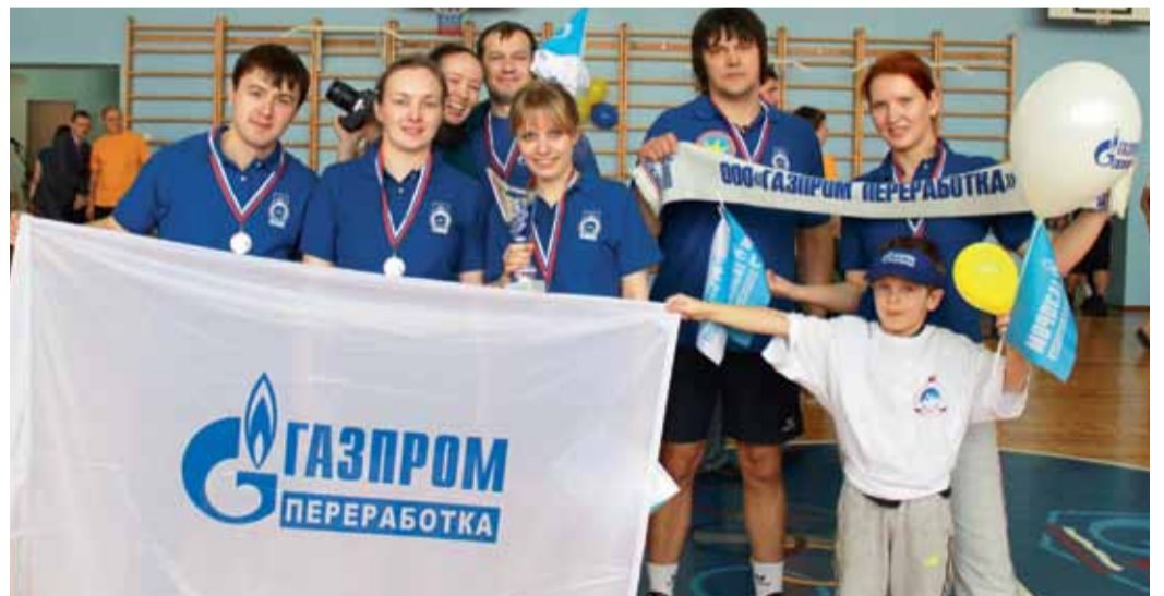
Молодежная сборная ЗПКТ – победитель Первоапрельского бума

Не остается в стороне молодежь завода и от добрых дел. Оказывается поддержка Общественной региональной организации родителей детей с ограниченными возможностями «Милосердие», детскому дому г. Надыма и Совету ветеранов г. Нового Уренгоя, Центру помощи бездомным животным «Подари мне жизнь». Также одна из приоритетных акций программы молодежных дел –