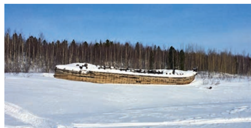
Баржа, на которой привозили заключенных на 503-ю стройку: спустя 70 лет сохранился только корпус из лиственницы

В еликая Отечественная война унесла миллионы человеческих жизней, и ее отголоски слышны до сих пор. Тысячи людей погибли не только на фронтах Второй мировой, но и после капитуляции гитлеровской Германии. В нескольких километрах от города Игарка Туруханского района Красноярского края находится страшный памятник тому времени — 503-я стройка. В путешествие по исторической трассе «Салехард — Игарка» отправились представители ООО «Газпром переработка». Секретная железная дорога «Салехард — Игарка». Она же: «Трансполярная магистраль», «сталинка», «Пятьсот третья», «Се-