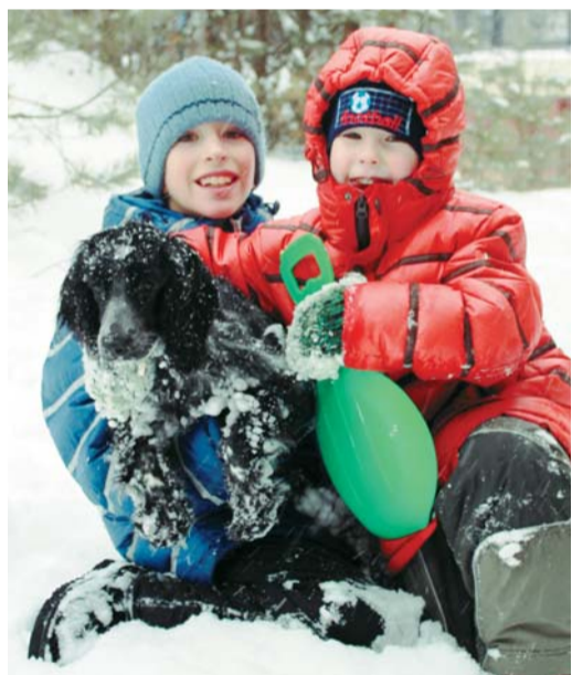
Вместе по сугробам

Говорят, что если в доме чаще всего слышен задорный детский смех – значит в этой семье детей воспитывают правильно. Иметь большую, дружную семью – это так же здорово, как и непросто. И если ты – мама троих детей, значит надо всегда быть готовой к тому, что каждому необходимо внимание, причем одновременно и постоянно!