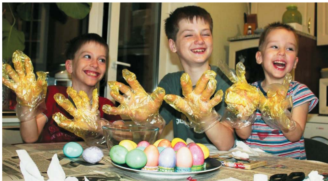
Готовимся к Пасхе