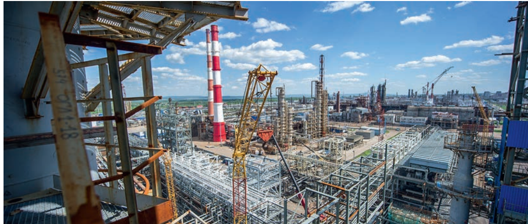
В 2015 году на ОАО «Газпром нефтехим Салават» планируется запуск установки изомеризации мощностью 434 тыс. тонн в год по сырью — на сегодняшний день идет активная фаза строительства

У Общества «Газпром нефтехим Салават» гигантская инвестиционная программа: только за ближайшие 4 года предприятие планирует освоить более 70 млрд руб. капитальных вложений на модернизацию технологической схемы НПЗ для наращивания производственных мощностей и обеспечения реализации определенных обязательств перед государством. Из крупных объектов в следующем году планируется запустить установку изомеризации, а еще через год — установку каталитического крекинга. Ведется проектирование модернизации пиролизного производства, а также строительства комплекса по производству акриловой кислоты.