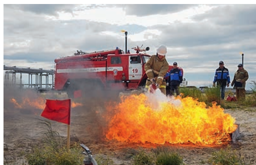
Соревнования по пожарно-прикладному виду спорта сопровождал пожарный караул ПЧ-19