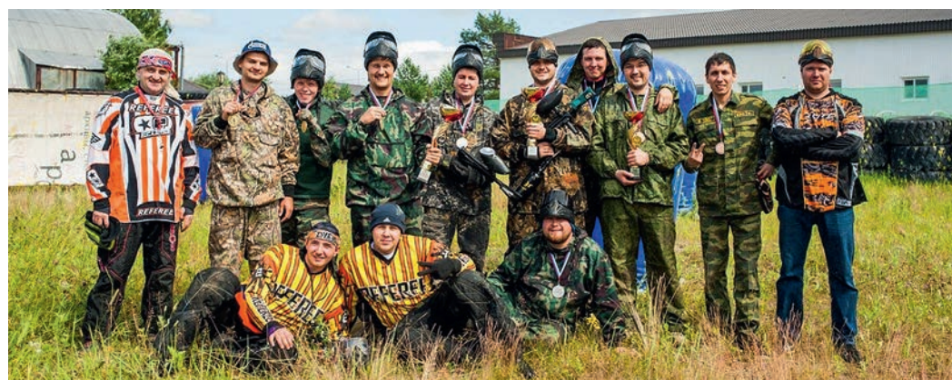
Пейнтбольный клуб — день открытых дверей

Вызов был принят! Команда начала подготовку к турнирам весенне-осеннего периода 2015 года. Любовь к выбранному виду спорта и усердные тренировки принесли свои плоды, да и результат не заставил себя ждать. Со своих первых соревнований — открытого турнира по пейнтболу в г. Пыть-Яхе — команда привезла две медали: золото за первое место во 2-м дивизионе и серебро за второе место в 1-м дивизионе. Удачный исход соревнований в Пыть-Яхе открыл команде «Витязи» возможность вы-