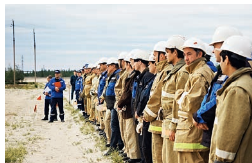
К соревнованиям по пожарно-прикладному спорту готовы!