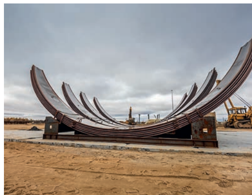
Комплекующие для парка шаровых резервуаров ГНС-2

Залетний период на этих новостройках был проведен значительный объем работ. На площадке УСК, которая разместится на территории почти в 30 га, полным ходом продолжают отсыпка грунта и сооружение свайных оснований. На строящейся головной станции,