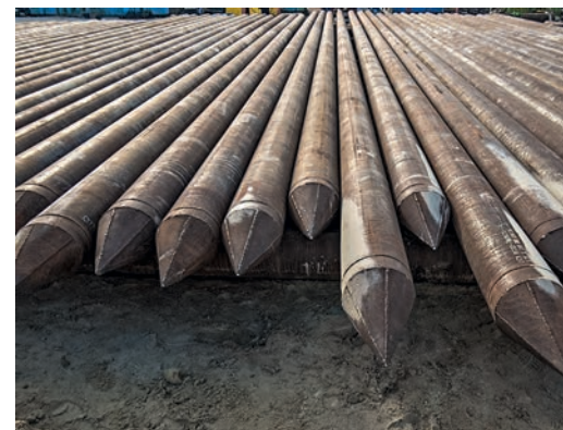
По плану 2015 года для свайных оснований объектов УСК предстоит погрузить в мерзлотные породы около 5 тысяч свай, каждую на глубину от 10 до 20 метров

свайных оснований здания манифольдной и узла замера количества и качества деэтанализованного конденсата, возводится парк шаровых резервуаров и многое другое. «Ввод этих объектов значительно увеличит имеющиеся у нас мощности, — отмечает директор ЗПКТ Игорь Чернухин. — Мы безболезненно сможем принимать возрастающие объемы конденсата ачимовских отложений и, соответственно, перекачивать для дальнейшей переработки на Сургутский ЗСК гораздо больше деэтанализованного конденсата».