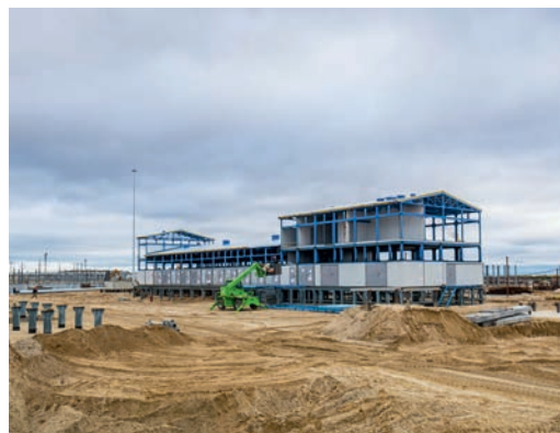
Оснащение насосной станции технологическим оборудованием идет полным ходом

с вводом которой мощности ЗПКТ по откачке деэтанализованного конденсата увеличатся еще на 5 миллионов тонн в год, также заметны существенные изменения. Возведена насосная станция, которая активно оснащается технологическим оборудованием, произведен монтаж