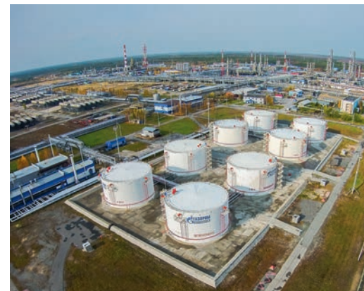
Сургутский ЗСК.

Успешно выполняются и социальные программы Общества «Газпром переработка». С января по август текущего года на реабилитационно-восстановительное лечение было направлено более трехсот человек. Около ста заводчан со своими семьями уже отдох-