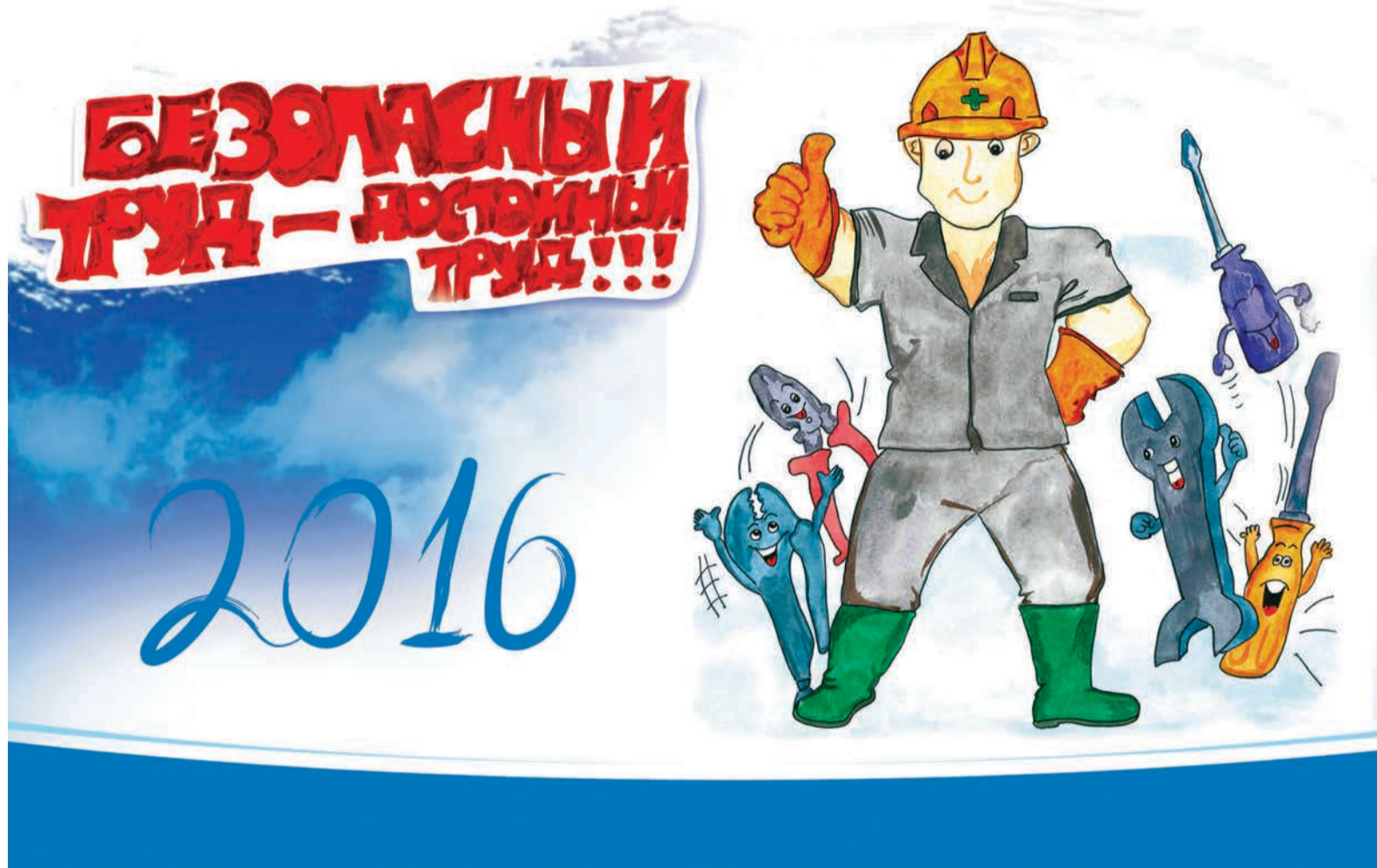
Коллективная работа детей сотрудников ООО «Газпром переработка», отдыхавших в 3-й смене 2015 года в ЦОД «Северянка»

В целях укрепления имиджа ПАО «Газпром» как социально ответственной компании 2016 год объявлен Годом охраны труда. В соответствии с этим в компании планируется проведение более 740 мероприятий, в которых примут участие 113 обществ и организаций ПАО «Газпром» и будут задействованы более 330 000 работников. Все это главным образом направлено на создание и внедрение инновационных решений, способствующих достижению целей производственной безопасности.