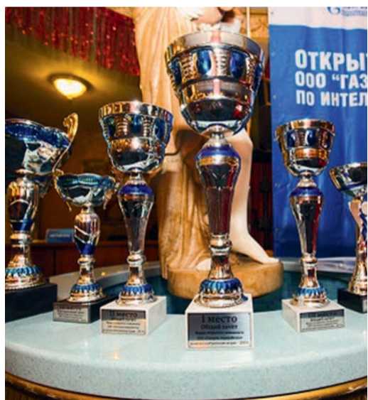
Кубки ждали своих обладателей

Поздравляем всех с достойными результатами и желаем дальнейших успехов!