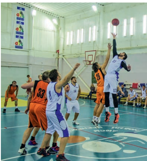
Мяч в игре!