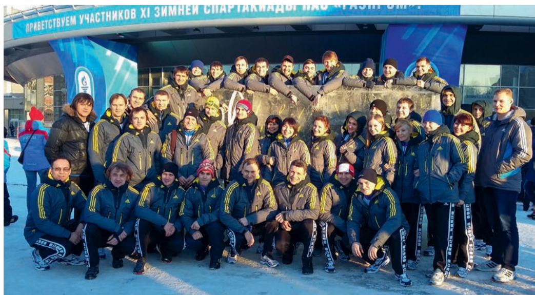
Сборная команда ООО «Газпром переработка» перед открытием Спартакиады в Уфе

С 12 по 19 февраля в Уфе прошла XI зимняя Спартакиада ПАО «Газпром», которая собрала около двух тысяч участников со всей России, а также Армении и Белоруссии. В состав команды ООО «Газпром переработка» впервые вошли представители компании «Газпром нефтехим Салават».