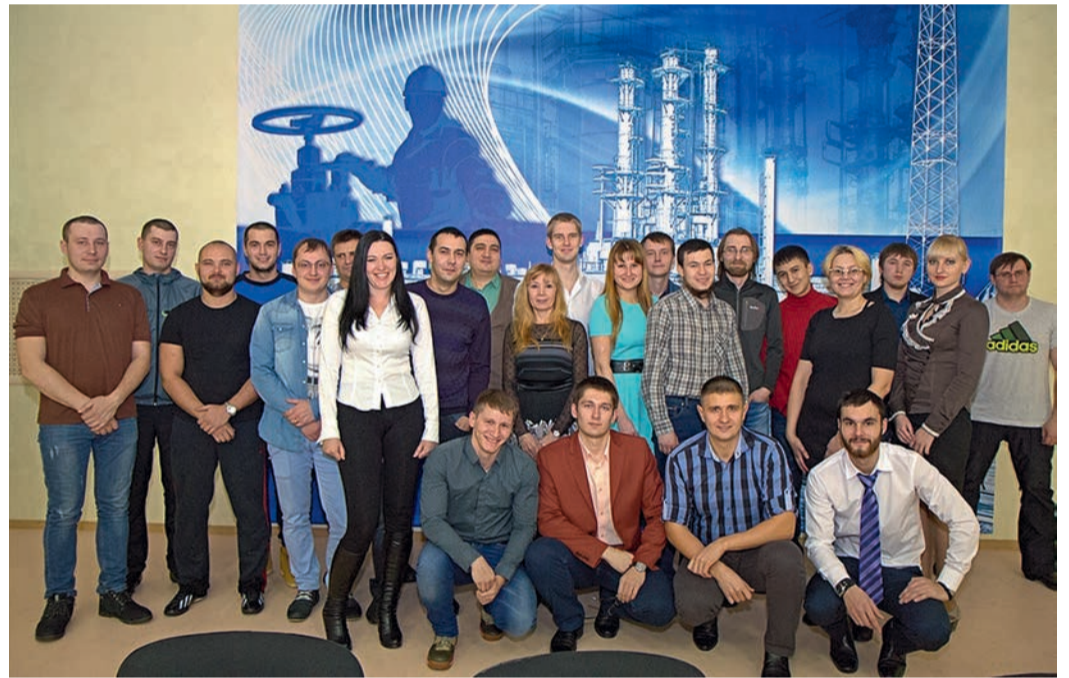
Участники первого отборочного этапа ЗПКТ на старте открытого чемпионата

В результате победителем в общем зачете стала команда «Борцы с умом», представлявшая ООО «Газпром добыча Уренгой». В их копилке достижений — участие в чемпионате мира по игре «Что? Где? Когда?». Серебро завоевала команда «ПремииУМ» от ООО «Газпром переработка». Уровень подготовки участников настолько высок, что конкурировать с ними в корпоративном зачете практически не представлялось возможным, поэтому достижения команды учитывались только в общем зачете. Третье место заняла уренгойская команда АО «РОСПАН ИНТЕРНЭШНЛ», которая имела в своем со-