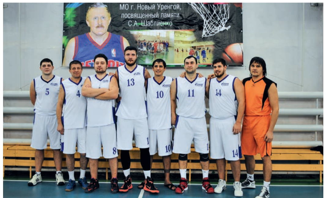
Команда баскетболистов ЗПКТ — серебряные призеры турнира-2016

«Задачами этого турнира являются не только популяризация баскетбола, но и формирование здорового образа жизни, вовле-