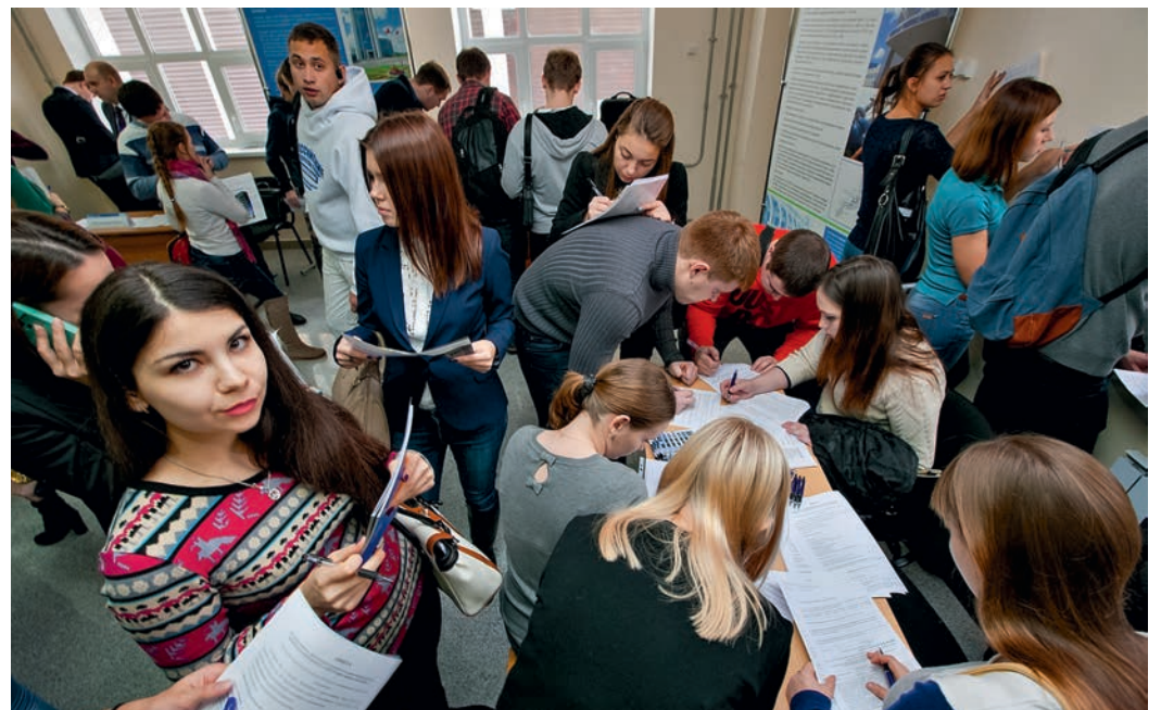
На ярмарке вакансий заявить о себе можно, заполнив анкету

— Насколько эффективно наше участие в ярмарках вакансий?