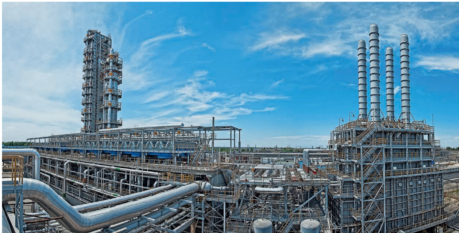
Астраханский газоперерабатывающий завод