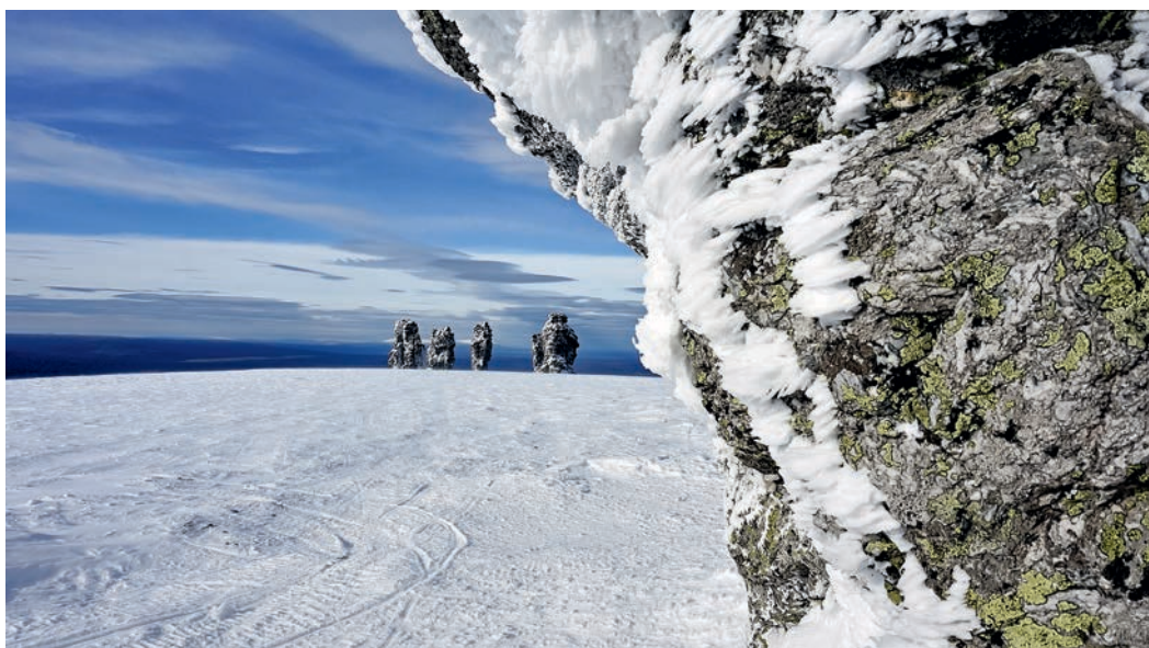
Столбы выветривания Маньпупунер. Республика Коми