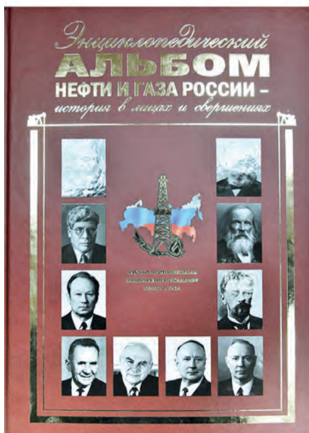
«Энциклопедический альбом нефти и газа России — история в лицах и свершениях»

В Сосногорске состоялась презентация книги «Энциклопедический альбом нефти и газа России — история в лицах и свершениях», в которую вошли очерки о работниках Сосногорского ГПЗ.