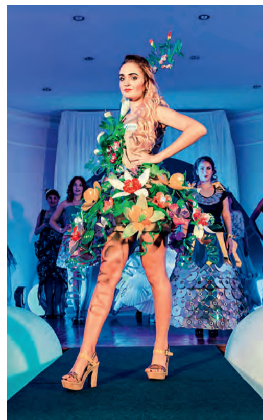
Демонстрация нарядов, сделанных участницами из подручных материалов

та славы. Моей стал конкурс «Заводчанка». Он предоставил прекрасную возможность заявить о себе. Теперь у меня в жизни есть еще один счастливый момент, который я буду вспоминать с особой теплотой!»