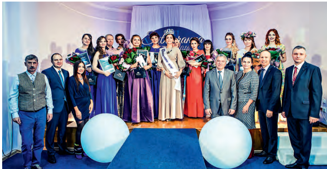
Жюри и организаторы конкурса «Заводчанка-2016»

«С тех пор как я устроилась работать на завод и узнала, что здесь проводят такой конкурс, всегда представляла себя его участницей, но никак не решалась. Теперь понимаю, что зря. В этом году все же сделала этот трудный и волнительный шаг, хотя были мысли: «А вдруг что-то не получится?» Но, к счастью, меня поддержали семья и мой дружный коллектив. Это было действительно здорово. Столько положительных эмоций и внимания! Столько людей нам помогало, такое количество разных профессионалов было задействовано! Все участницы очень переживали, казалось, что нервы не выдержат. Но мы друг друга поддерживали, если у кого-то что-то не получалось — исправляли, смеялись и шутили. Каждому человеку выпадает своя мину-