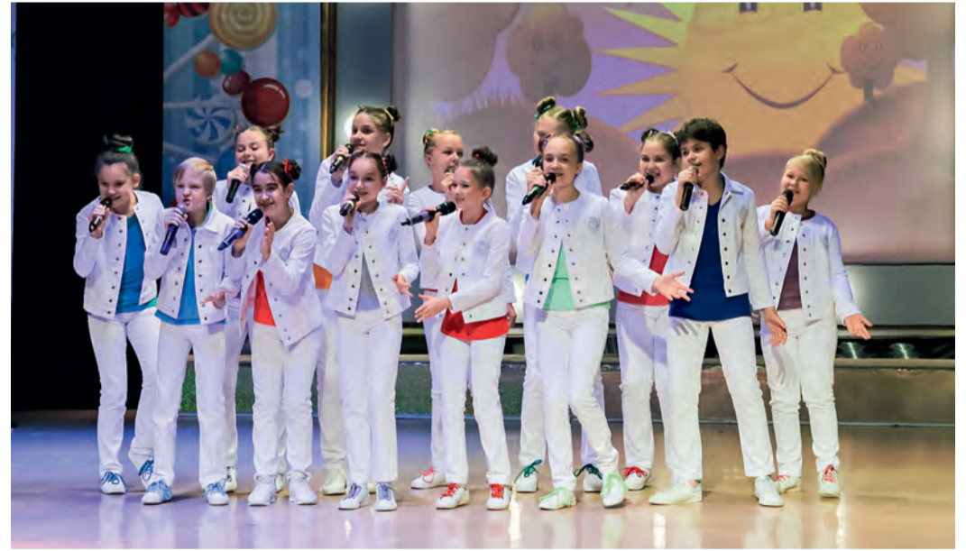
Задорный коллектив ансамбля New Style