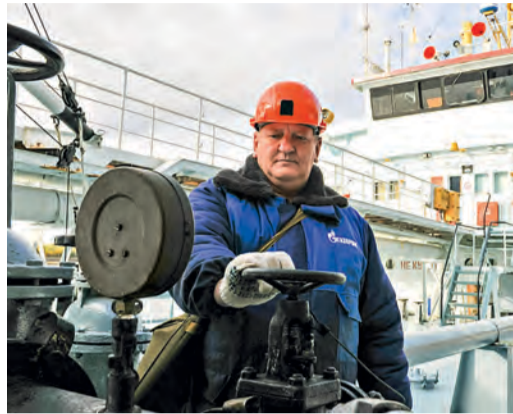
Контроль отгрузки нефтепродуктов

На причале Завода по стабилизации конденсата имени В. С. Черномырдина была произведена последняя отгрузка дизельного топлива в судно НПП-1028. Пункт назначения — село Селиярово Ханты-Мансийского автономного округа. В ходе навигации отгружено более 110 тысяч тонн моторных топлив, что на 3% превышает показатели 2015 года.