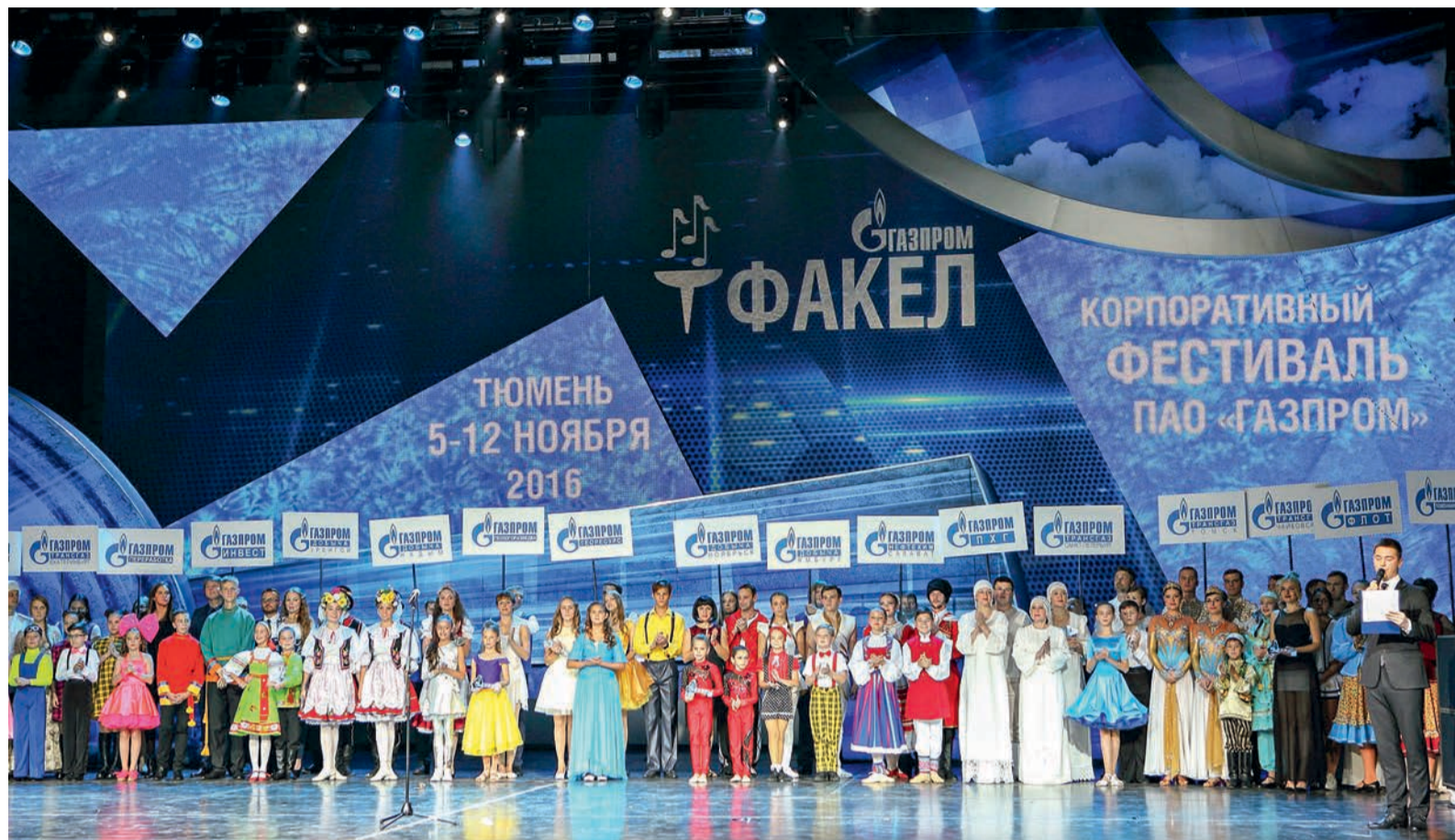
Открытие Зонального тура корпоративного фестиваля «Факел» (северная зона): парад участников

Отремели фанфары Зонального тура корпоративного фестиваля «Факел» (северная зона), который проходил в Тюмени с 5 по 12 ноября. Выступление творческой делегации Общества «Газпром переработка» прошло успешно. Все четыре номера, представленные в конкурсной программе, отмечены призами. Наша компания впервые за всю свою историю примет участие в финале фестиваля.