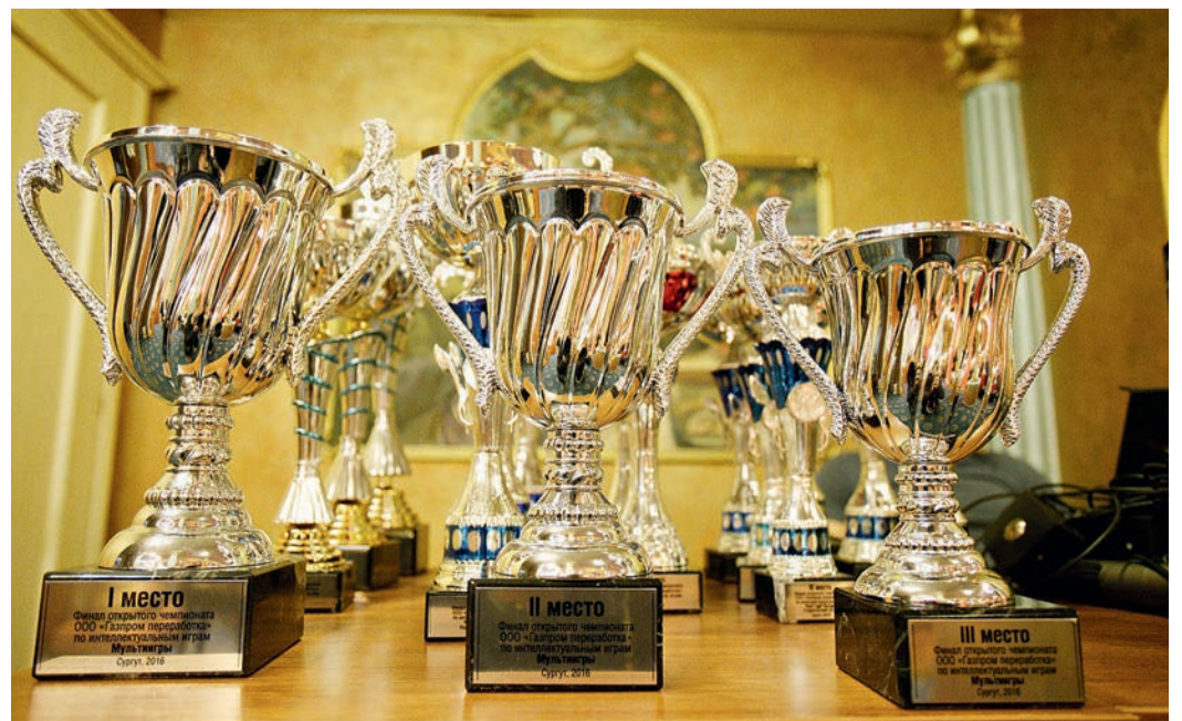
За призы чемпионата ООО «Газпром переработка» в течение месяца боролись 94 команды