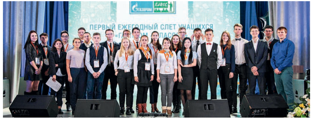
Сборная команда «Энергетика»

«Нашей команде необходимо было обеспечить месторождение электроэнергией. Ребята представили проект многофункциональ-