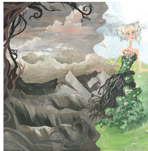
Амалия Зихор, Сосногорский ГПЗ