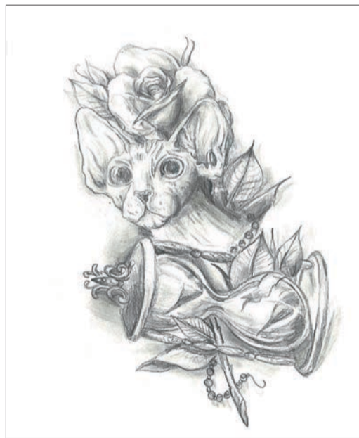
Рисунок «Мечта» Александра Куриновского, финалиста конкурса «Юный художник»