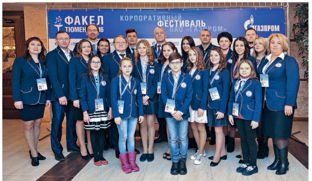
Делегация ООО «Газпром переработка» на Зональном туре корпоративного фестиваля «Факел» признана самой стильной