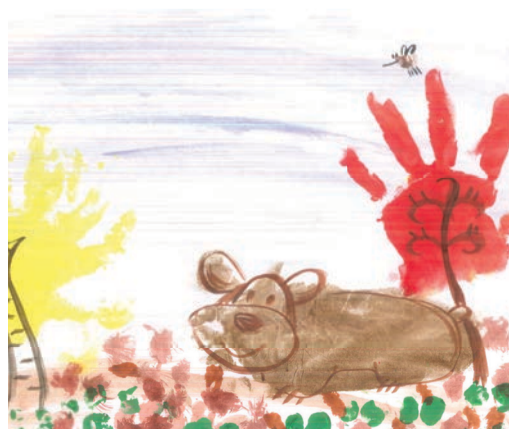
Дима Рытов, 1 год 7 месяцев