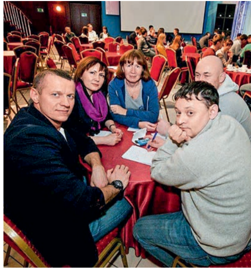
Знатоки в перерыве между раундами