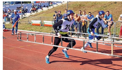
На международном чемпионате по пожарно-прикладному спорту в Варне