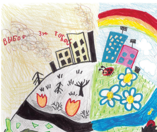
Артем Рытов, 7 лет