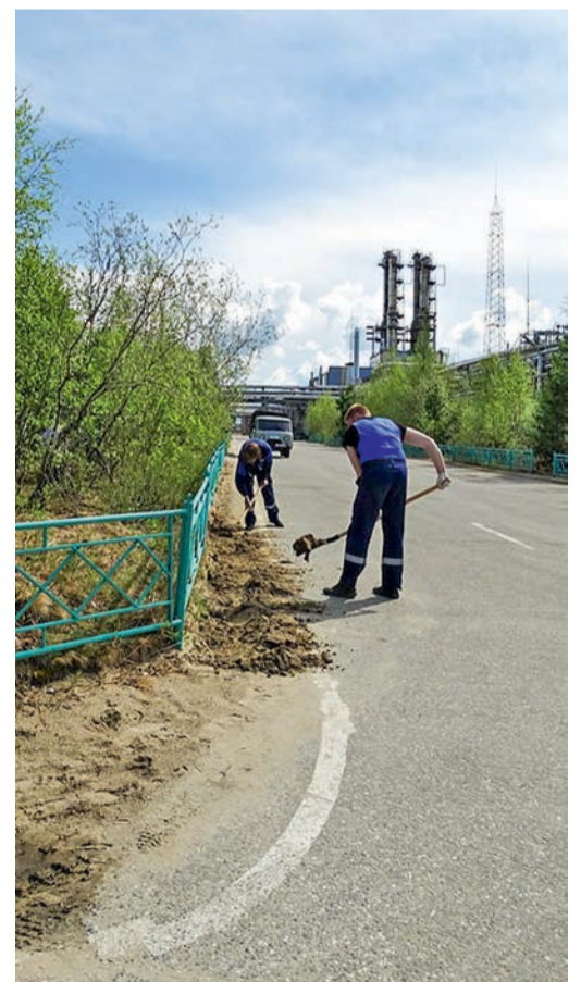
На территории технологических объектов будет порядок!