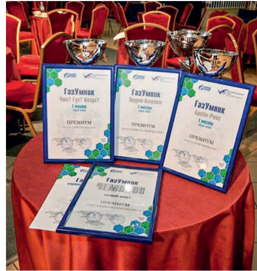
Интеллектуальный урожай: три победы в четырех дисциплинах турнира и 1 место в общем зачете