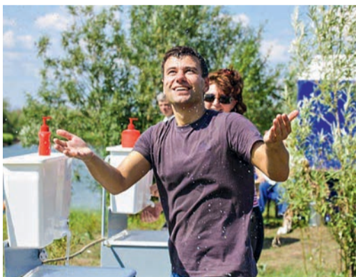
Так просто радоваться мелочам, не прибегая к «допингу»