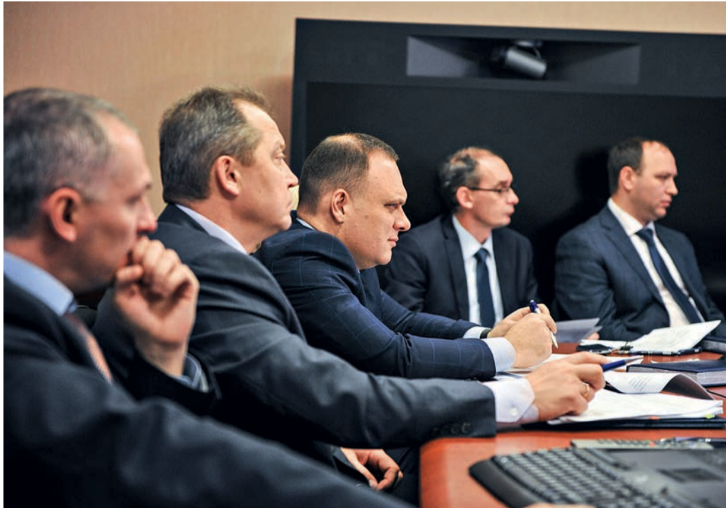
Члены конкурсной комиссии