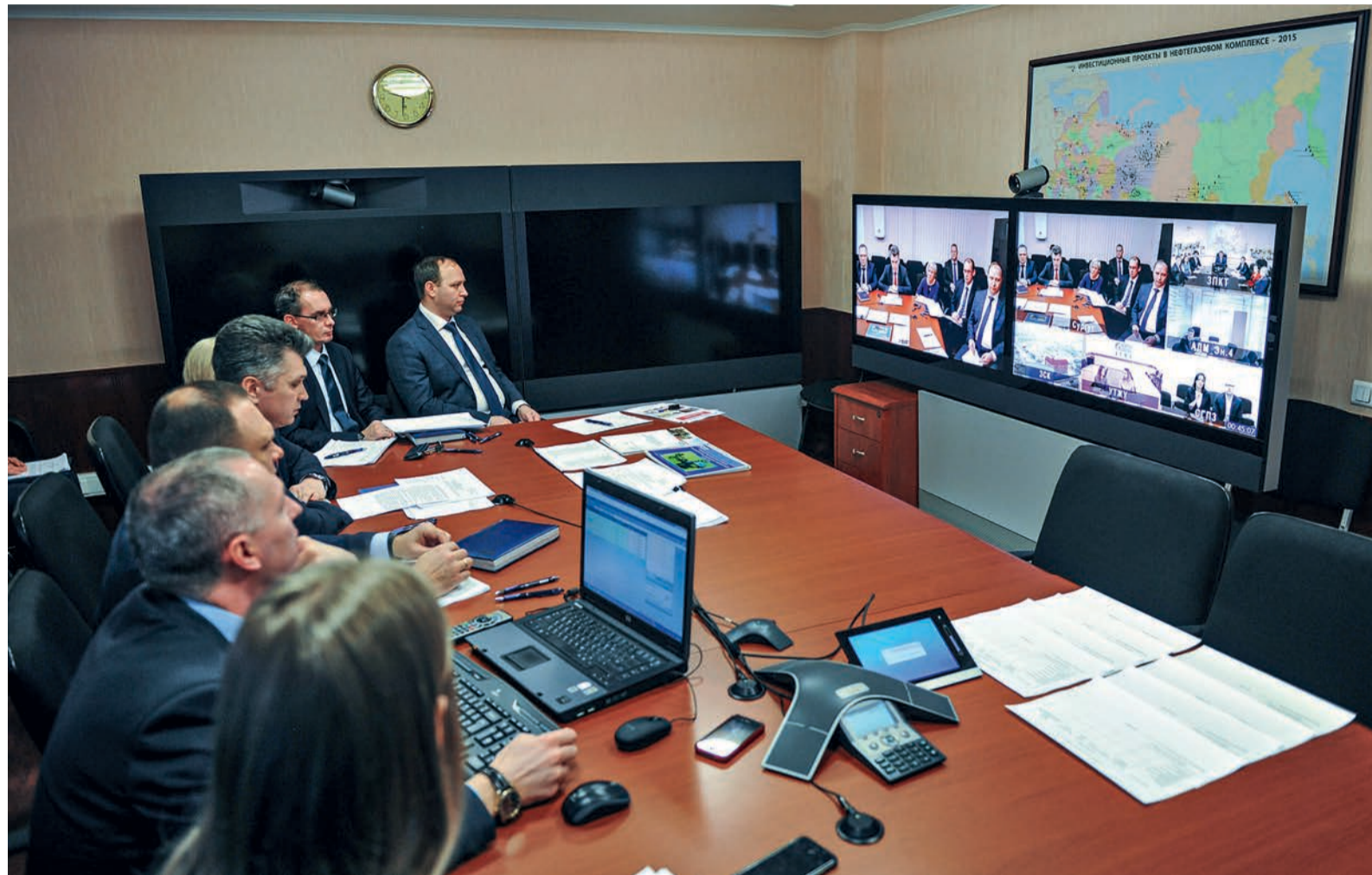
Научно-техническая конференция проходила в этом году в режиме телемоста

В Обществе завершила работу научно-техническая конференция молодых специалистов ООО «Газпром переработка», в которой приняли участие 20 работников со всех филиалов компании и студенты Сургутского государственного университета. Участники защищали свои проекты по трем направлениям: охрана труда, промышленная и пожарная безопасность, повышение эффективности и надежности производственных объектов компании, автоматизация технологических процессов и информационные технологии.