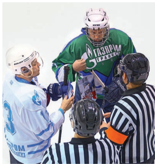
Традиционный обмен вымпелами перед игрой

Победителя турнира определяли по сумме очков (3 начисляется за победу в игровое время, 2 — за победу по буллитам, 1 — команде, уступившей в серии послематчевых буллитов). Проведя четыре игры без поражений, сборная переработчиков шла вровень с командой ООО «Газпром нефтехим Салават». Обе дружины записали в свой актив по 12 очков. Однако в решающей игре сур-