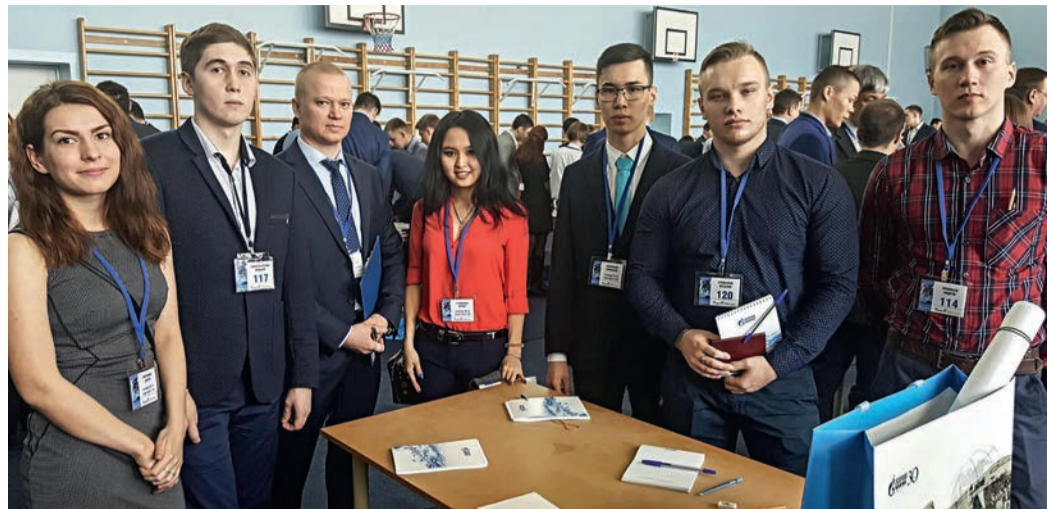
Конкурсанты готовы работать в газодобывающих компаниях Западной Сибири

Общество «Газпром переработка» участвует в конкурсе «Успешный старт» с 2010 года. Первые победители были трудоустроены на ЗПКТ в 2011 году. Всего по итогам предыдущих конкурсов на завод принято девять человек по следующим специальностям: инженеры, операторы и слесари по ремонту технологических установок. Знания, профессионализм и опыт этих работников стали залогом перспективного карьерного роста и включения в корпоративную программу жилищного обеспечения.