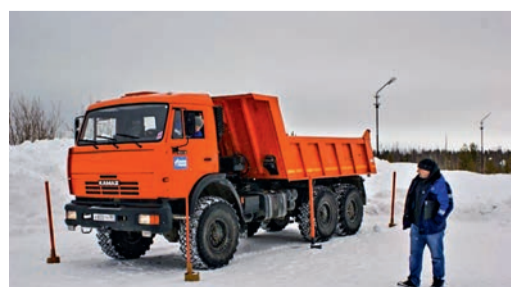
Практическая часть конкурса. Задание — заезд в гараж