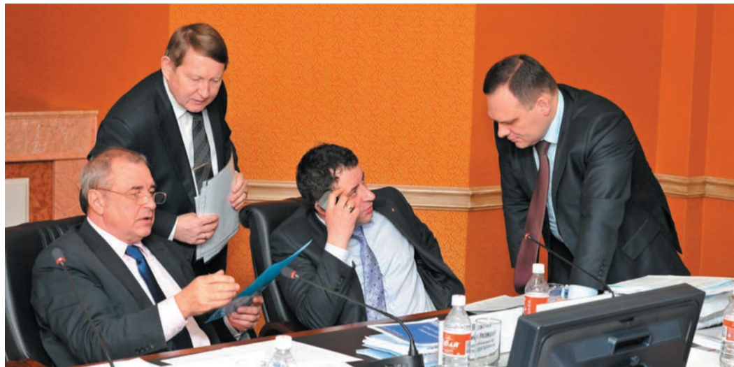
На этапе становления компании приходилось решать колоссальный объем кадровых и производственных вопросов

Приходилось достаточно много доказывать, какое количество людей и техники нам необходимо, без чего не может развиваться