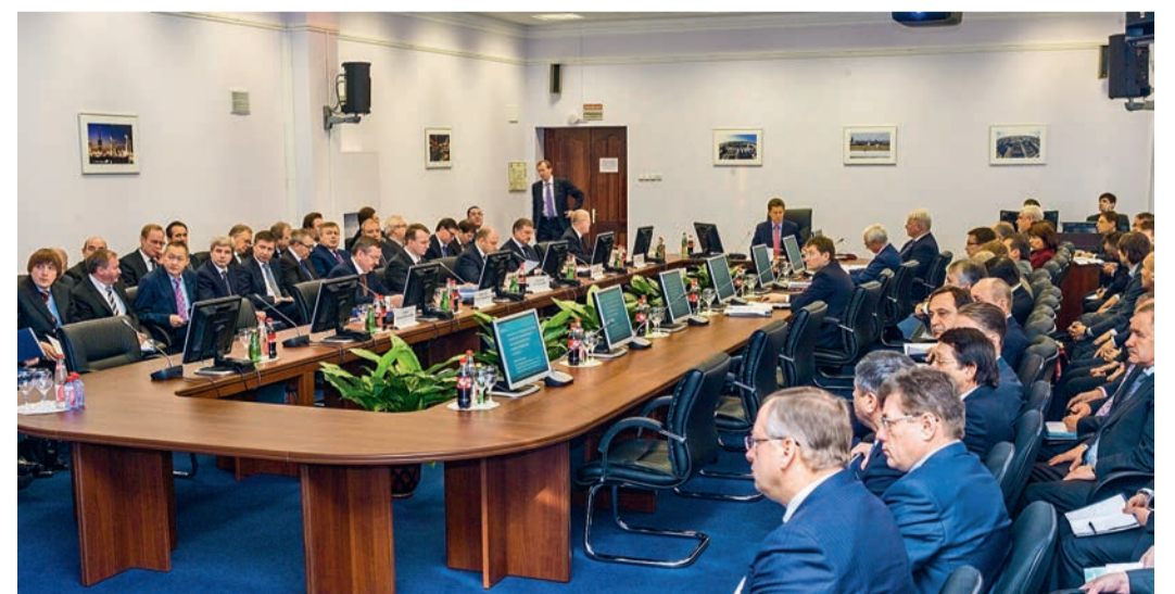
Историческое выездное заседание Правления ОАО «Газпром» на Сургутском ЗСК. 2011 год

— Какие задачи вы ставили перед своими подчиненными на самом первом этапе? Что было самое главное в создании нового направления — новой дочки «Газпрома»?