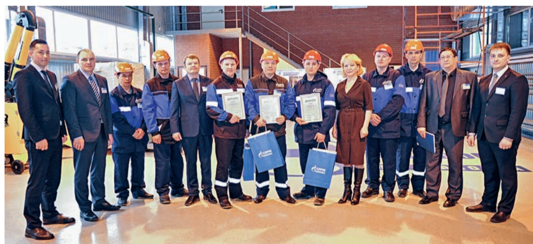
Церемония награждения победителей