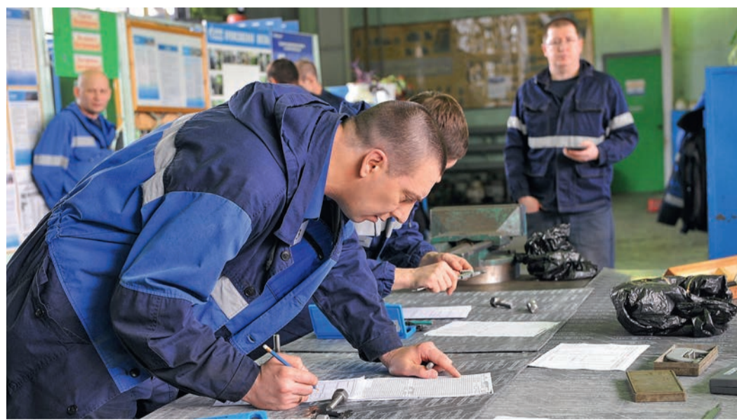
Практическая часть конкурса слесарей по ремонту технологических установок

На Заводе по стабилизации конденсата им. В. С. Черномырдина подвели итоги смотра-конкурса профессионального мастерства рабочих на звание «Лучший по профессии».