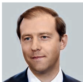
Мантуров Денис Валентинович Министр промышленности и торговли Российской Федерации