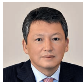
Кулибаев Тимур Аскарлович Председатель Объединения Юридических лиц «Казахстанская ассоциация организаций нефтегазового и энергетического комплекса KAZENERGY», Председатель Президиума Национальной палаты Предпринимателей Республики Казахстан «Атамекен»