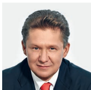
Миллер Алексей Борисович Председатель Правления ПАО «Газпром»