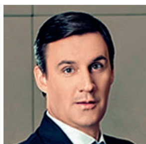
Патрушев Дмитрий Николаевич Председатель Правления АО «Россельхозбанк»