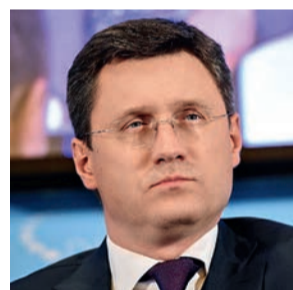
Новак Александр Валентинович Министр энергетики Российской Федерации