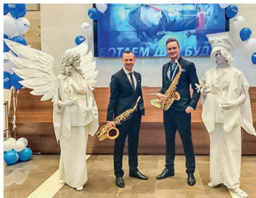
Праздничное фойе в офисе администрации Общества, г. Санкт-Петербург

Впереди новые сложные, но интересные проекты. Обозримое будущее пройдет под знаком движения вперед: наша география станет шире, производство — масштабнее, коллектив — сильнее. Эти обстоятельства потребуют от каждого работника определенной концентрации усилий и самоотдачи.