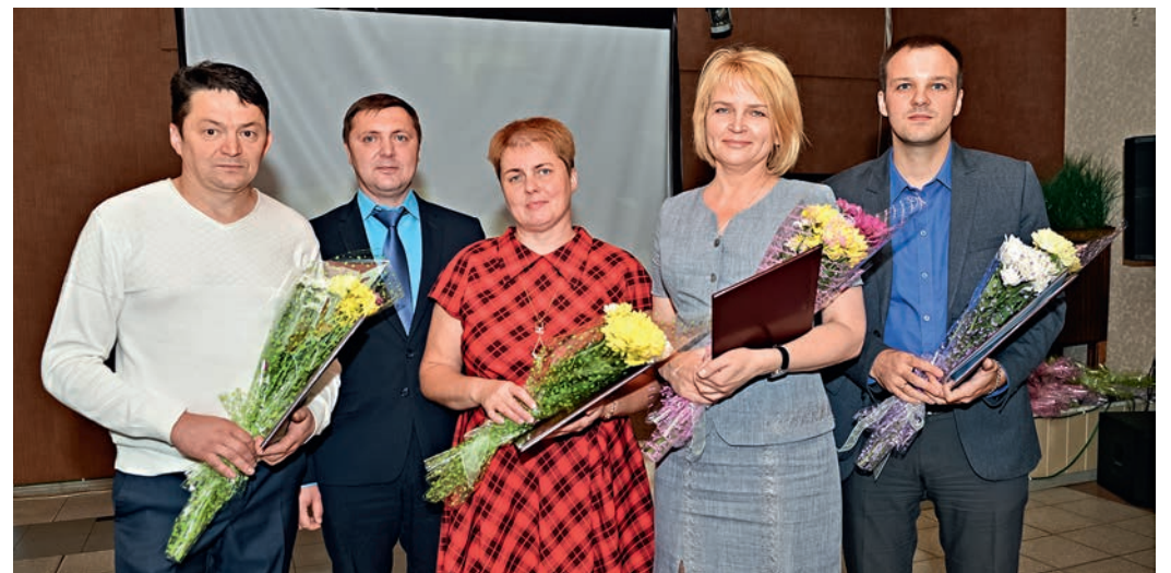
Работники Сосногорского ГПЗ, награжденные почетными грамотами муниципального района «Сосногорск»