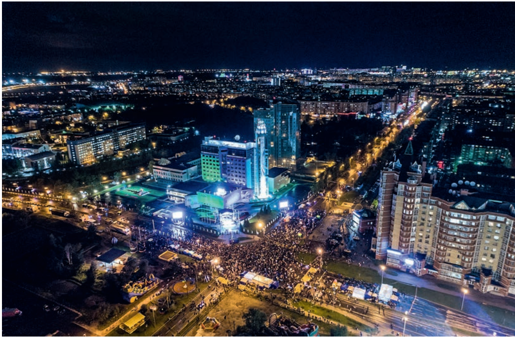
День газовика в Сургуте

Профессиональный праздник, как и полагается, газовики отметили в кругу своих коллег. О том, как это было, читайте в нашем материале.