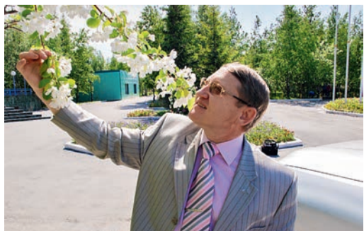
Весна в Сургуте