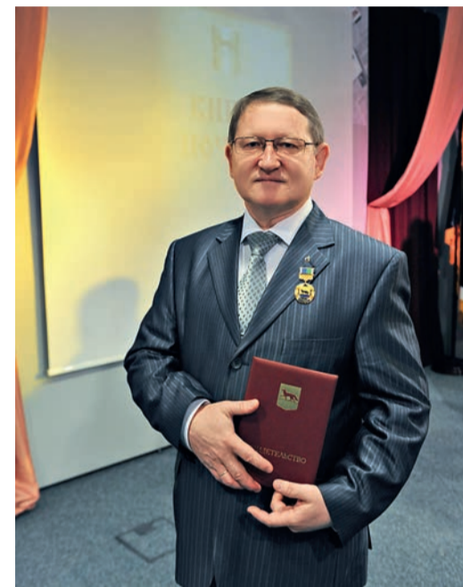
На вручении «Знака Почета»

ские способности он был назначен заместителем генерального директора по кадрам и социальному развитию на создаваемом предприятии ООО «Газпром переработка».