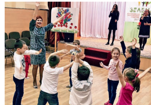
В рамках мероприятия СМУС УТЖУ организовали концерт