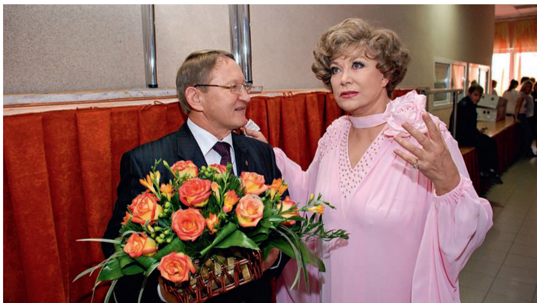
Встреча с легендой отечественной эстрады