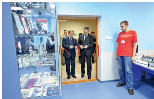
Открытие лаборатории робототехники в Сургутском государственном университете