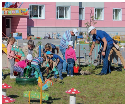
Работники ЗПКТ проводят озеленение площадки детского сада «Звездочка»

«Сегодня мы не только восстанавливаем озеленение территорий детских садов. Пройдет время, ребята вырастут, а вместе с ними и саженцы