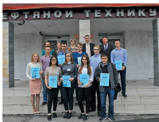
Победители и участники V Научно-практической конференции «Нефть, газ, экология — 2017»

Если подводить своеобразный итог, то можно с уверенностью констатировать, что Год экологии в ООО «Газпром переработка» прошел успешно. Сотни гектаров убранной территории, тысячи кубометров вывезенного мусора, десятки экологических акций, участниками которых стали не только работники Общества «Газпром переработка», но и жители городов, где располагаются филиалы предприятия. Вместе мы сохраняем природу, делаем наш общий дом Землю чище, лучше и красивее.