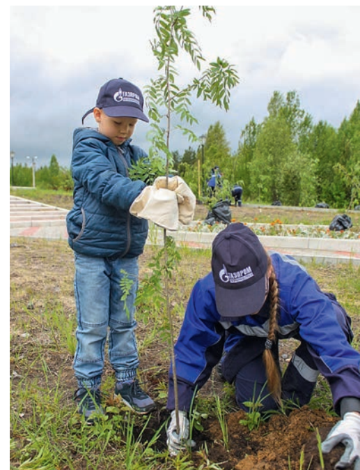
Многие работники Сосногорского ГПЗ пришли на субботник вместе с детьми

Работники Управления по транспортировке жидких углеводородов также внесли свой вклад