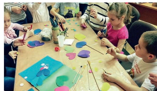
Изготовление красочного панно «Давайте вместе беречь планету!»

Кроме того, во втором квартале 2017 года в УГЖУ был организован конкурс детских тематических рисунков и плакатов на тему «Международный день Земли», а также проведен мастер-класс по изготовлению поделок «Вторая жизнь вещей и материалов».