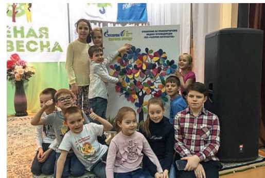
Главные участники детского экологического праздника

УГЖУ представило презентацию по итогам проведенных мероприятий в поддержку Всероссийского субботника «Зеленая весна — 2017». Первичная профсоюзная организация и Совет молодых ученых и специалистов Управления организовали для детей работников — членов Нефтегазстройпрофсоюза экологический праздник «Давайте вместе украшать планету!», в рамках которого прошли конкурсы, викторины, изготовление красочных панно, а также выставки детских поделок и рисунков.