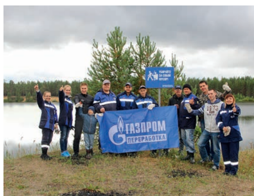
В рамках объявленного в ПАО «Газпром» Года экологии работники Сосногорского ГПЗ приняли участие в субботнике