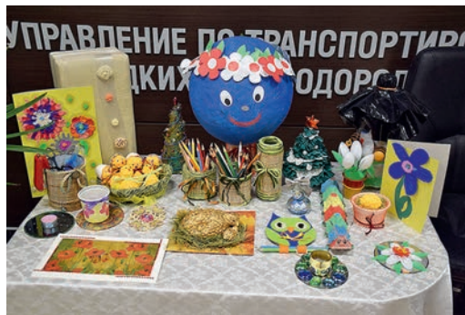
Выставка детских поделок и рисунков

Управление по транспортировке жидких углеводородов ООО «Газпром переработка» завоевало приз зрительских симпатий в конкурсе «Газпром профсоюза» на лучшую видеопрезентацию деятельности профсоюзной организации на тему экологии. Конкурс среди 32 дочерних обществ ПАО «Газпром» проходил с 20 марта по 5 июня 2017 года.