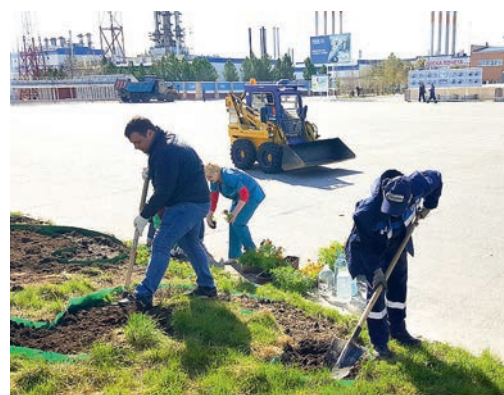
Работники ЗПКТ готовят клумбы к высадке цветов