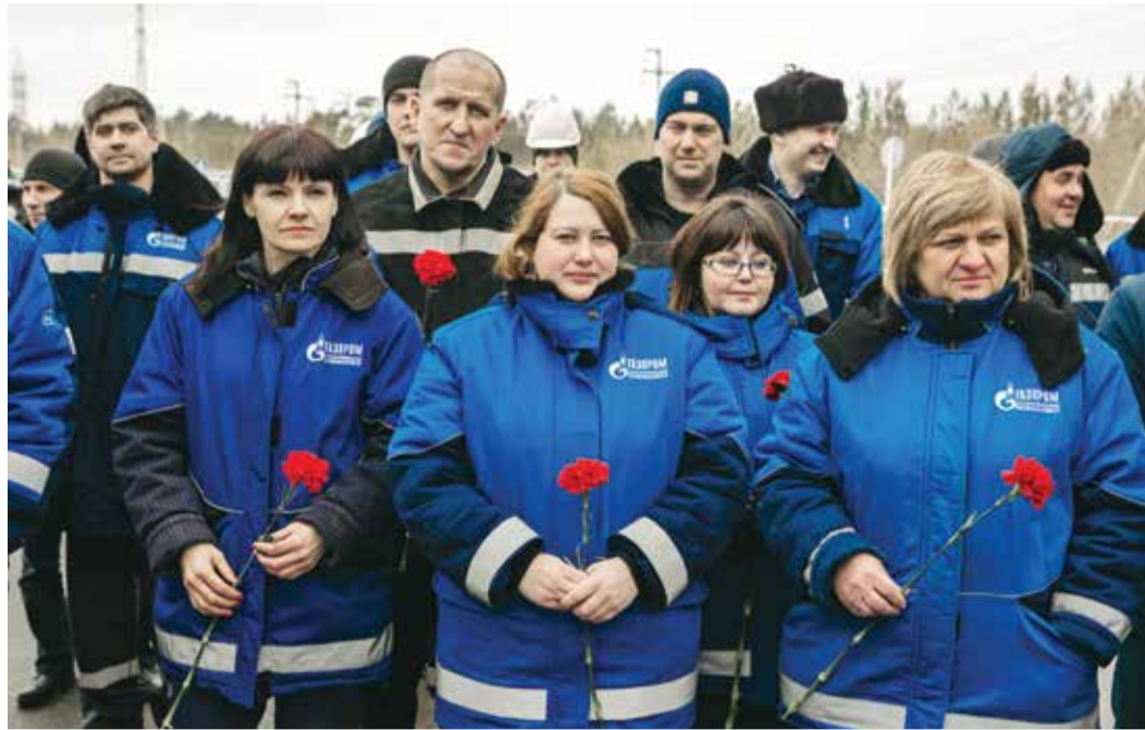
Участники митинга — работники Сургутского ЗСК

9 апреля в России отметили День памяти, посвященный 80-летию со дня рождения Виктора Степановича Черномырдина — яркого политика, видного государственного деятеля, талантливого человека. Он был очень многогранен — директор, крепкий хозяйственник, министр СССР, создатель «Газпрома», Председатель Правительства России, государственный и общественный деятель. Виктор Степанович скончался 3 ноября 2010 года на 73-м году жизни.