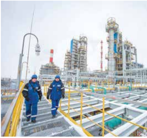
ООО «Газпром нефтехим Салават»