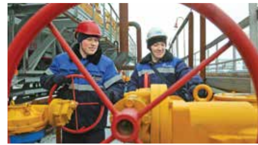
Современные отечественные агрегаты успешно справляются с задачей охлаждения

Основные темы были посвящены аттестации рабочих мест, вопросам производственного травматизма, современной нормативно-правовой базе в области охраны труда. Завершилось обучение экзаменом, по результатам которого были выданы удостоверения уполномоченных по охране труда. За время обучения было аттестовано 24 уполномоченных, избранных из разных подразделений Сосногорского ГПЗ.