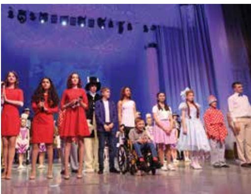
Участники благотворительного фестиваля