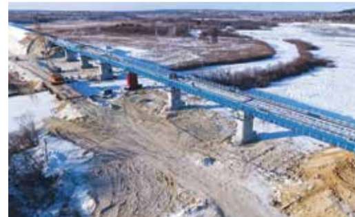
Мост через р. Большая Пера — один из объектов железнодорожных коммуникаций для Амурского ГПЗ

Для организации сообщения между площадкой строительства Амурского ГПЗ и общей сетью железных дорог уложено около 22 км железнодорожных путей необщего пользования. Построены путепровод через региональную автодорогу и железнодорожный мост через реку Большая Пера.