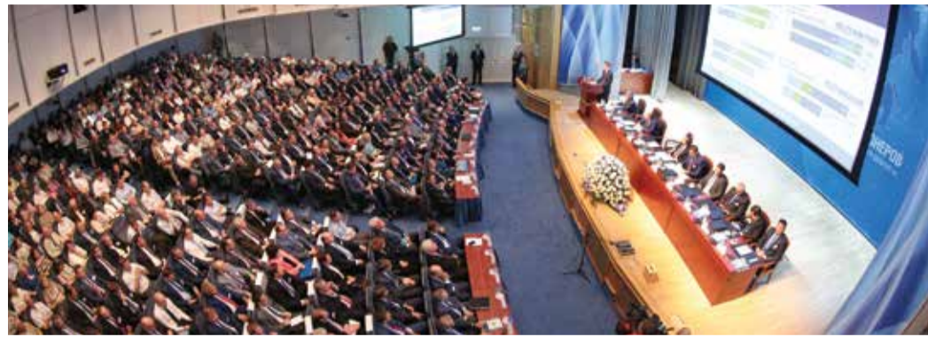
Общее собрание акционеров ПАО «Газпром». 2017 год

Принято решение провести годовое Общее собрание акционеров ПАО «Газпром» 29 июня 2018 года в г. Санкт-Петербурге. Подчеркивалось, список лиц, имеющих право на участие в собрании акционеров, будет составлен на основании данных реестра акционеров ПАО «Газпром» на конец операционного дня 4 июня 2018 года. Совет директоров включил в повест-