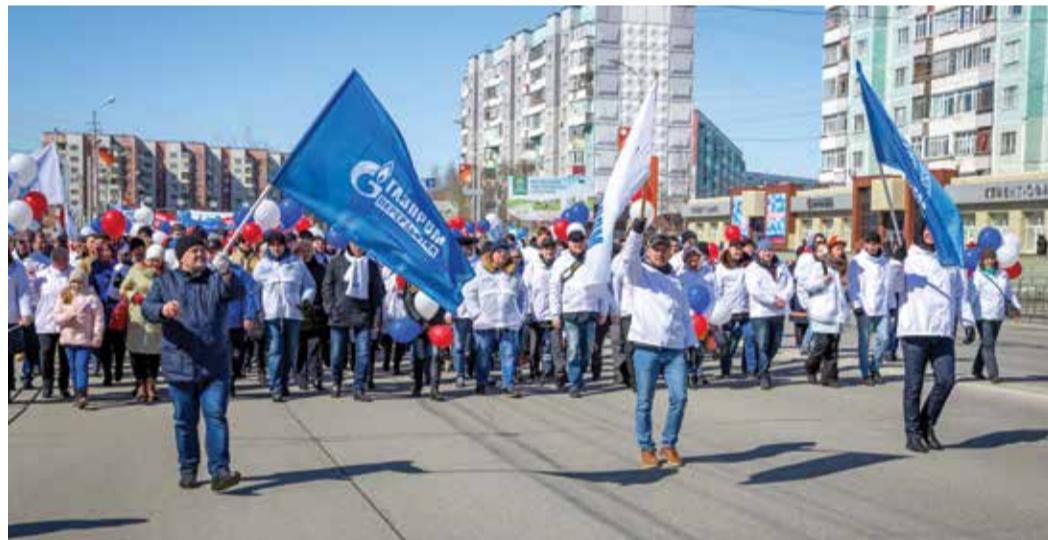
Работники Сургутского ЗСК на праздничном шествии

ООО «Газпром трансгаз Санкт-Петербург» и Межрегиональной профсоюзной организацией «Газпром профсоюз». Трудовые коллективы прошли по главной улице города – Невскому проспекту, финишировав на Дворцовой площади.