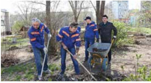
Работники ООО «Газпром добыча Астрахань» на субботнике

1 мая в честь Дня весны и труда во многих городах России прошли торжественные шествия трудовых коллективов, в которых приняли участие работники ООО «Газпром переработка».