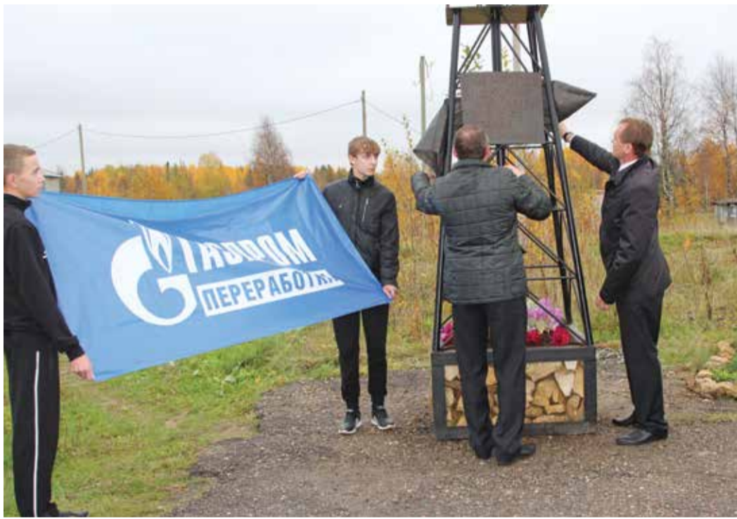
Церемония открытия памятного знака «Первая скважина» в п. Верхнеижемском

Он обеспечил производство свыше 50% всей технологической сажи, вырабатываемой в Советском Союзе. Этот продукт был необходим для изготовления резинотехнических изделий, без которых не могли обойтись ни автотранспорт, ни авиация, ни многие другие отрасли промышленности. В 1943 и 1944 гг. в результате научно-исследовательских работ инженеры получили сажу, близкую по качеству к импортной саже П-33.