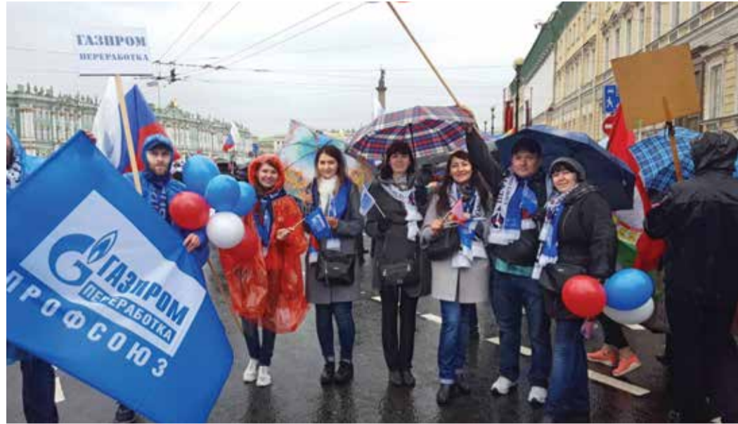
Работники Администрации Общества

В Санкт-Петербурге колонны возглавляли представители «Единой России» и профсоюзы. Делегация Объединенной первичной профсоюзной организации «Газпром переработка профсоюз» прошла в колонне Нефтегазстройпрофсоюза совместно с