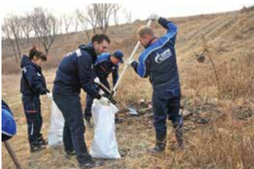
Экокоманда ООО «Газпром переработка Благовещенск»

– Сегодня компания «Газпром переработка Благовещенск» приняла участие в городском субботнике на территории родника. Порадовало, что мусора в этом году было намного меньше. Люди начинают понимать ценность и уникальность этой территории, мы рады этому. Мы очистили территорию вдоль дороги, у источника и сопку. Куда было можно пройти – прошли везде. Мы с готовностью участвуем в таких мероприятиях, нам не безразлично состояние города, в котором мы теперь живем.