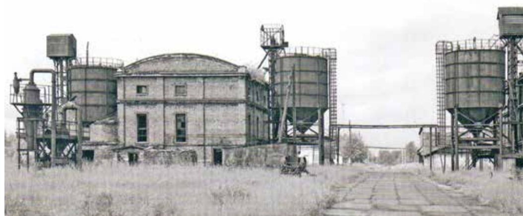
Крутянский сажевый завод. Его корпуса простояли до 2008 года

Среди филиалов Общества «Газпром переработка» есть такой, чей вклад в Победу в Великой Отечественной войне переоценить невозможно.