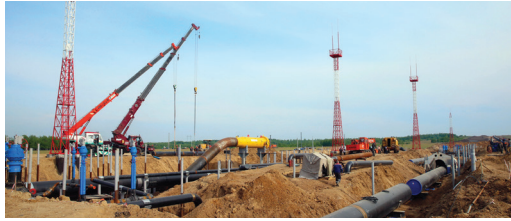
Строительство производственных мощностей газопровода «Сила Сибири»