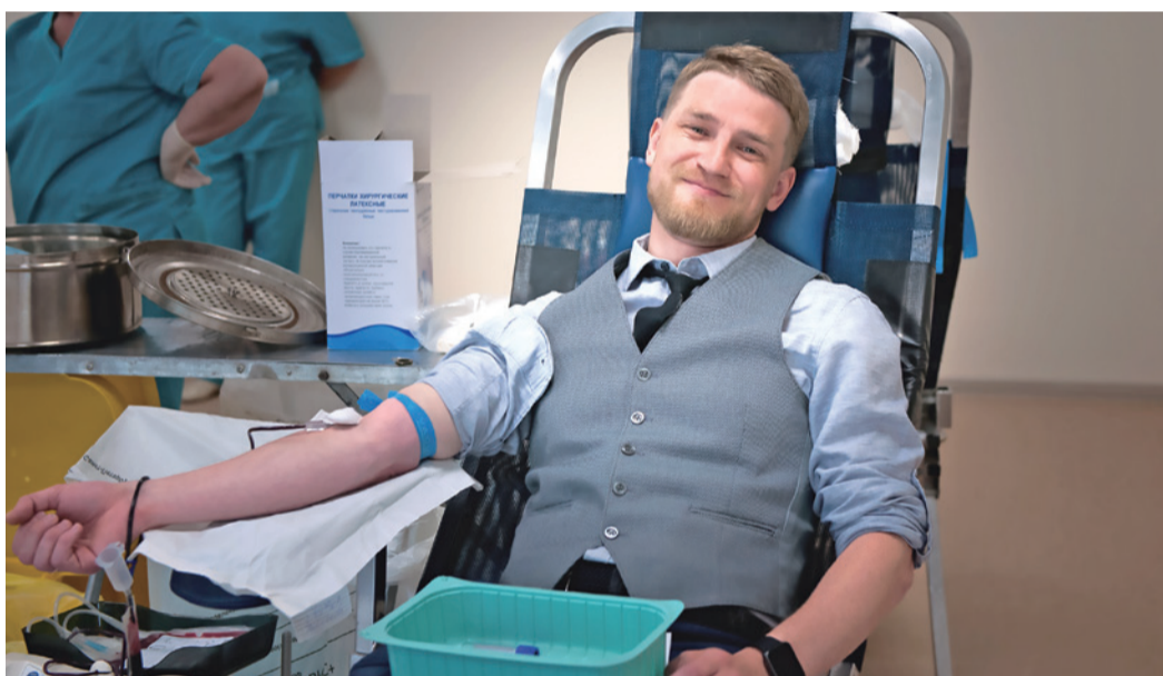
День донора в ООО «Газпром переработка»

«Уходящий Год добровольца – это не только повод подвести итоги, но и поставить новые