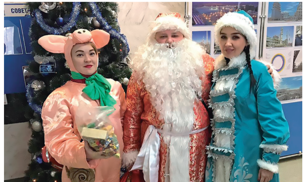
Новогоднее поздравление от молодых работников Астраханского ГПЗ