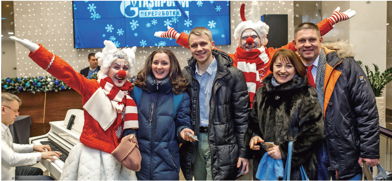
Помощники Деда Мороза поздравляют работников Администрации с Новым годом

Закончилась череда зимних праздников, и хочется вспомнить, как в Обществе «Газпром переработка» отметили наступивший Новый год. В филиалах предприятия уже давно сложились праздничные традиции, которым не изменяют многие годы, в Администрации Общества они только формируются, тем интереснее узнать, как коллеги в разных уголках России встречали 2019 год.