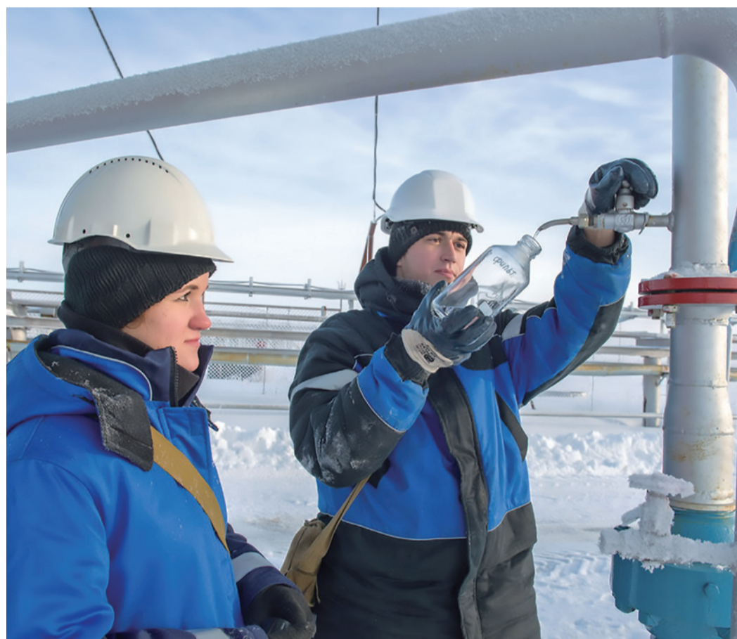
Отбор проб для лаборатории Завода по подготовке конденсата к транспорту

На заводе заменен катализатор и изменена схема его загрузки на комплексе по обогащению моторных топлив. Это дало возможность увеличить выпуск дизельного топлива с гарантированным сохранением его каче-