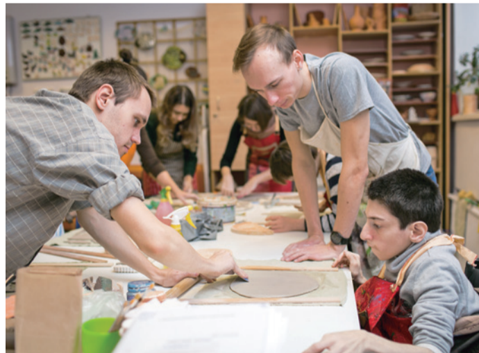
Помощь была оказана арт-студии Психоневрологического интерната № 3