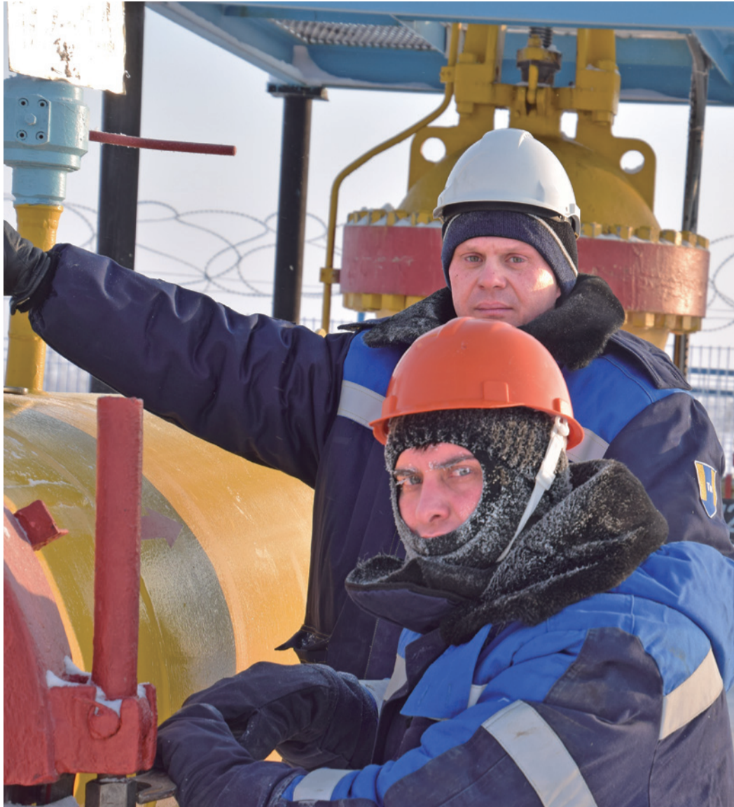
Сотрудники Управления по транспортировке жидких углеводородов за работой

На Сургутском ЗСК проведенный комплекс подготовительных мероприятий обеспечил высокую степень готовности перехода на увеличенный межремонтный период работы технологического оборудования. Это позволит в дальнейшем увеличить выпуск высококачественной продукции. Активно выполнялась работа по точечной настройке режимов технологических установок геосегмента «Западная Сибирь» в