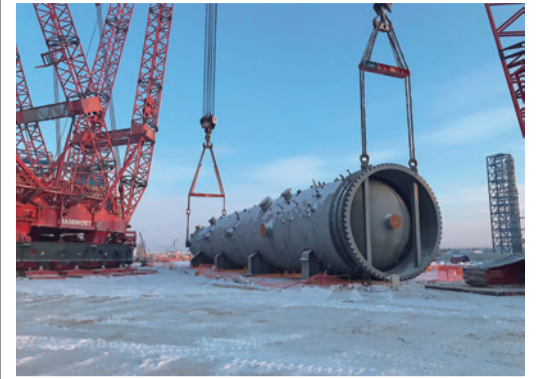
Строительство Амурского газоперерабатывающего завода. Декабрь 2018 года

На Амурском ГПЗ полностью развернуто строительство. Параллельно с ведением строительно-монтажных работ на площадке, на заводах идет изготовление различных аппаратов и насосно-компрессорного оборудования, трубопроводов и запорно-регулирующей арматуры, автоматизированных систем управления и систем связи. До пуска завода осталось меньше двух лет.