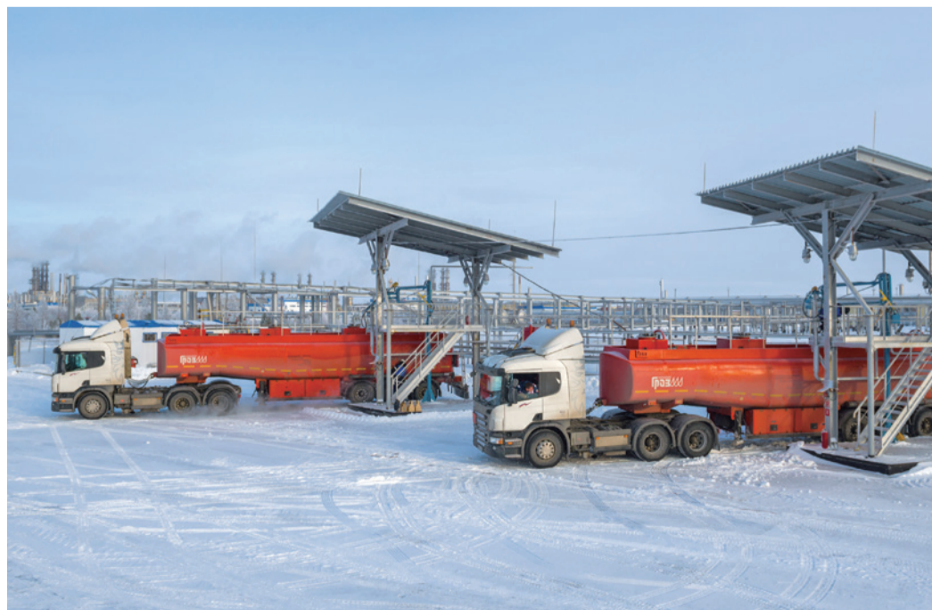
Наливная эстакада Завода по подготовке конденсата к транспорту. Отгрузка топлива для реактивных двигателей марки ТС-1.