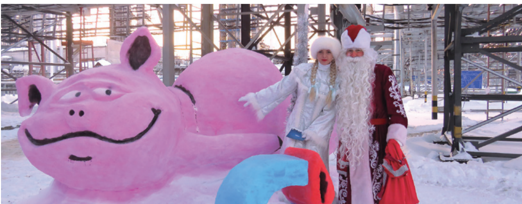
Новогоднее творчество заводчан «Веселый пятачок»

В Сургутском филиале Общества «Газпром переработка» подведены итоги новогоднего творческого конкурса на лучшее оформление уличных участков. Ежегодно подразделения Завода по стабилизации конденсата имени В. С. Черномырдина украшают свои территории ледовыми скульптурными композициями с символом наступившего года, выполненными собственными силами.