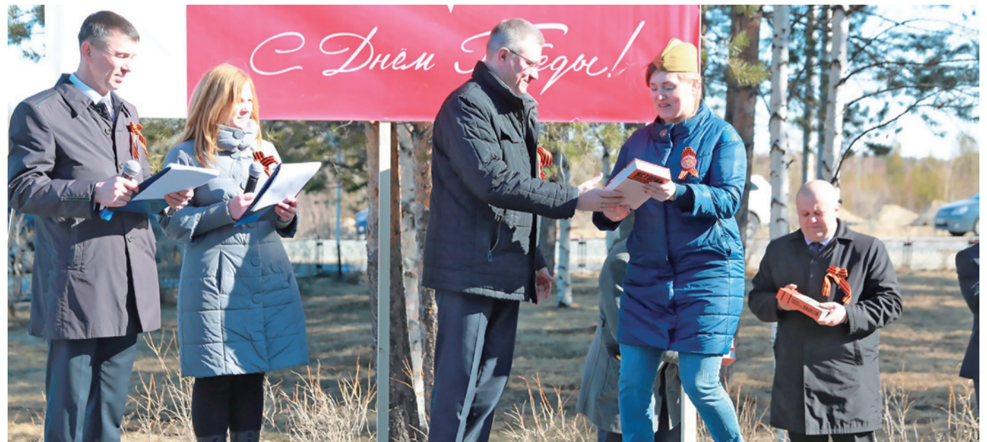
Вручение книг «История, рассказанная народом» на праздничном мероприятии на Сургутском ЗСК