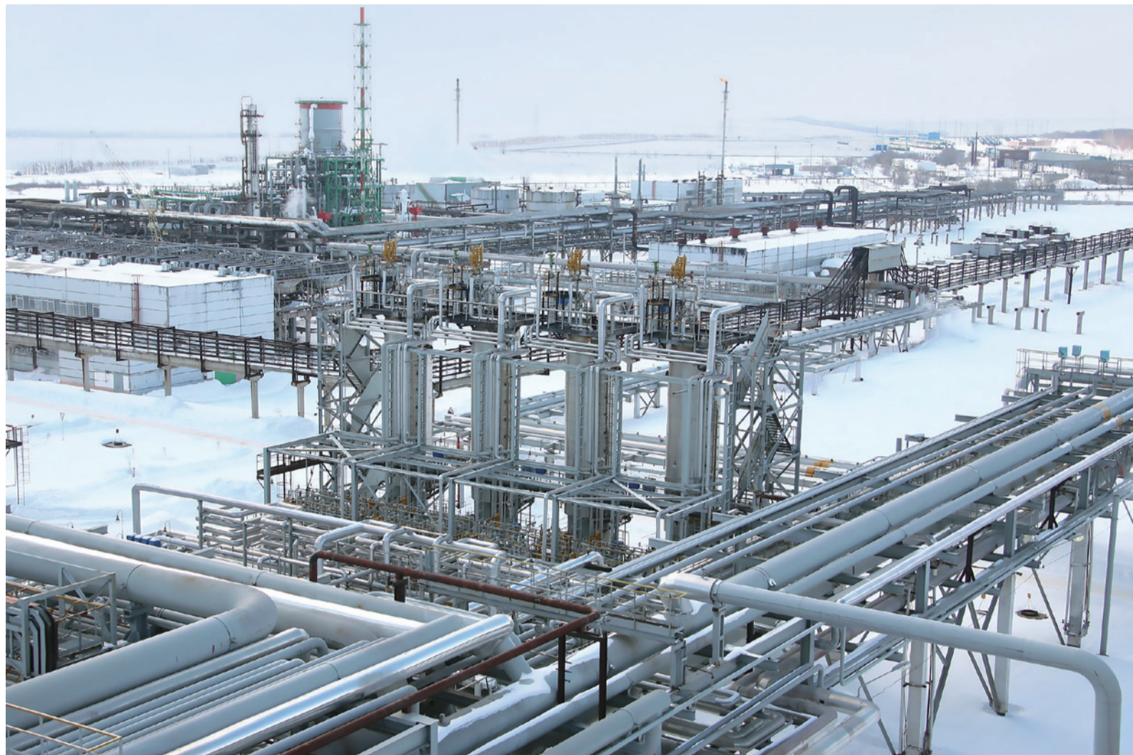
Оборудование второй и третьей очереди Оренбургского гелиевого завода