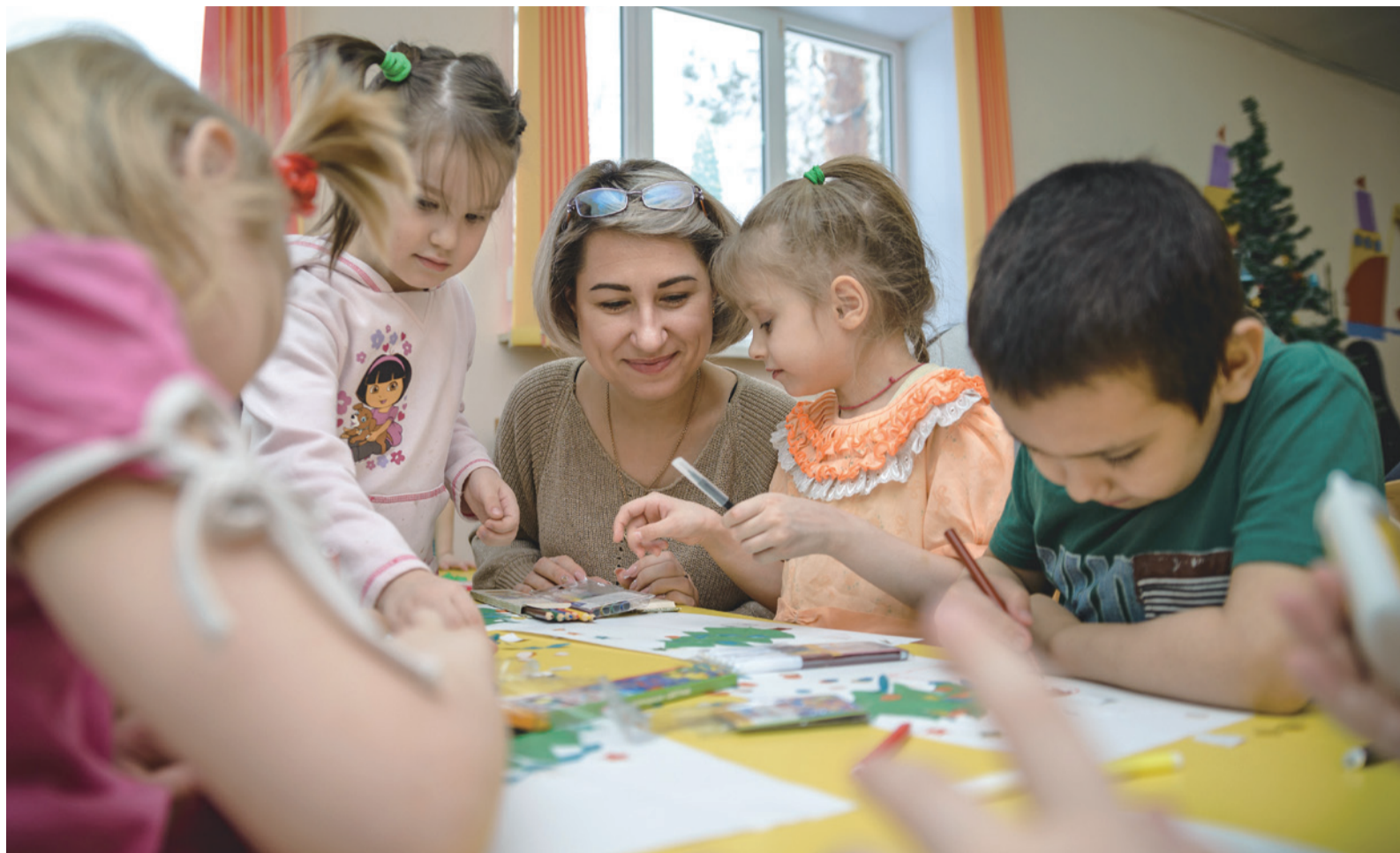
Молодые работники гелиевого завода в Оренбургском фтизиатрическом санатории

2018 год в России был объявлен Годом добровольца (волонтера). Сотрудники ООО «Газпром переработка» приняли участие во многих благотворительных акциях и мероприятиях.