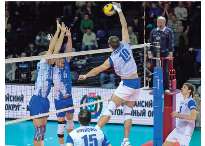
Поддержка спорта высоких достижений