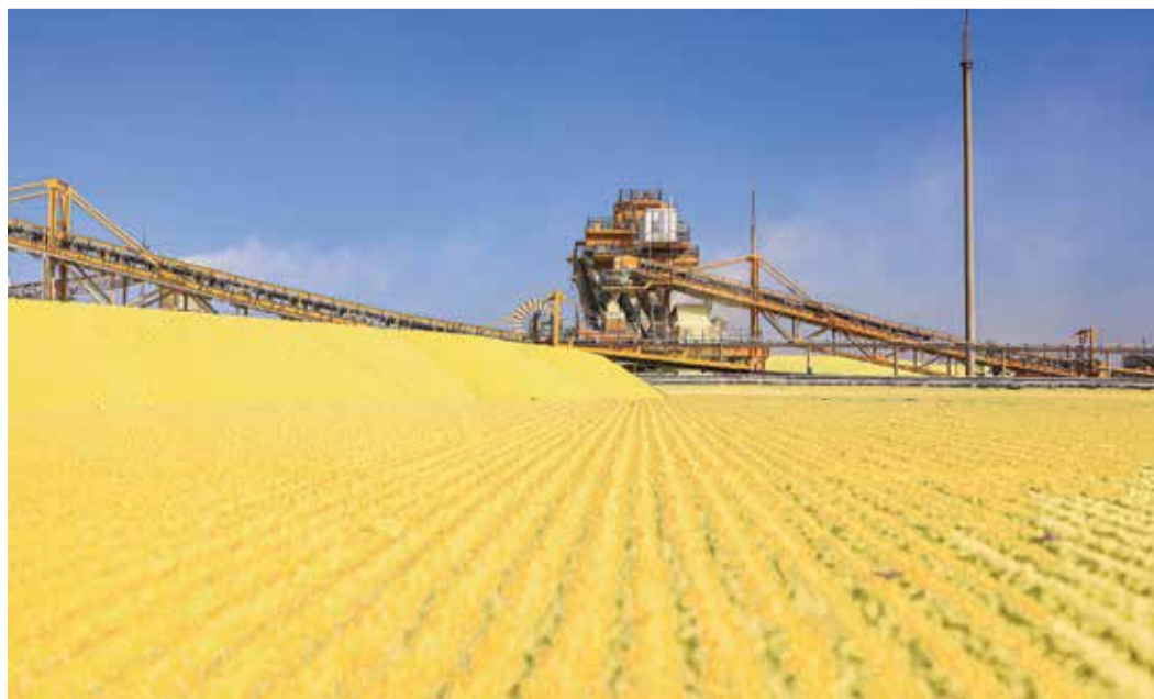
Установка гранулированной серы фирмы Enersul LP1