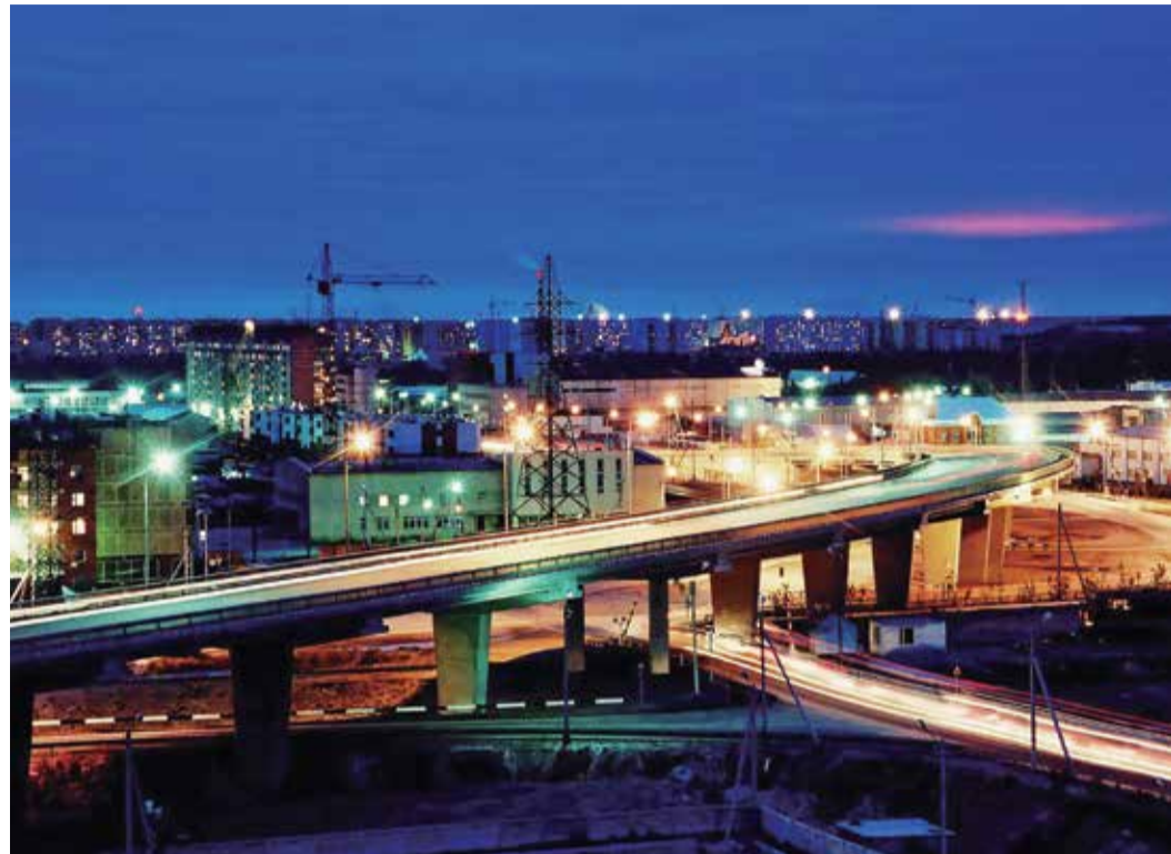
Новый Уренгой. Виадук

Работники Завода по подготовке конденсата к транспорту из Нового Уренгоя приняли участие в федеральной акции «Ночь музеев», организованной единственным на Ямале музеем изобразительных искусств. Мероприятие, приуроченное к Международному дню музеев, прошло 16 мая. Его цель — показать ресурс, возможности, потенциал современных учреждений, привлечь в музеи молодежь.