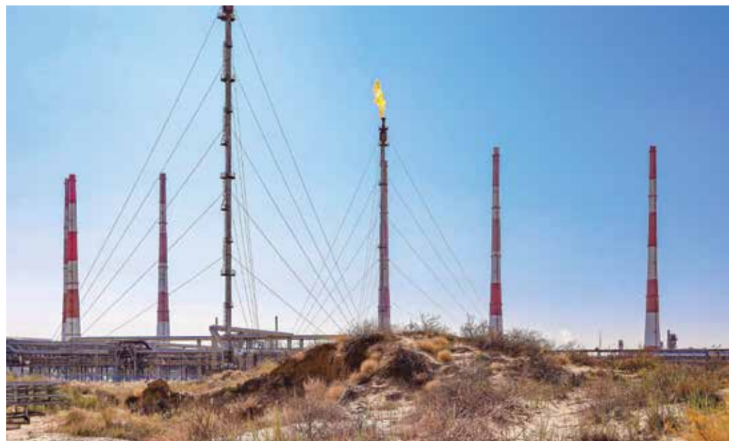
Вид на Астраханский ГПЗ