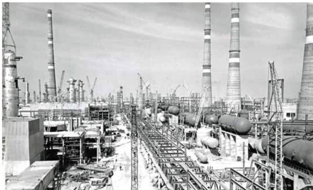
Строительство Астраханского ГПЗ. 1980-е годы