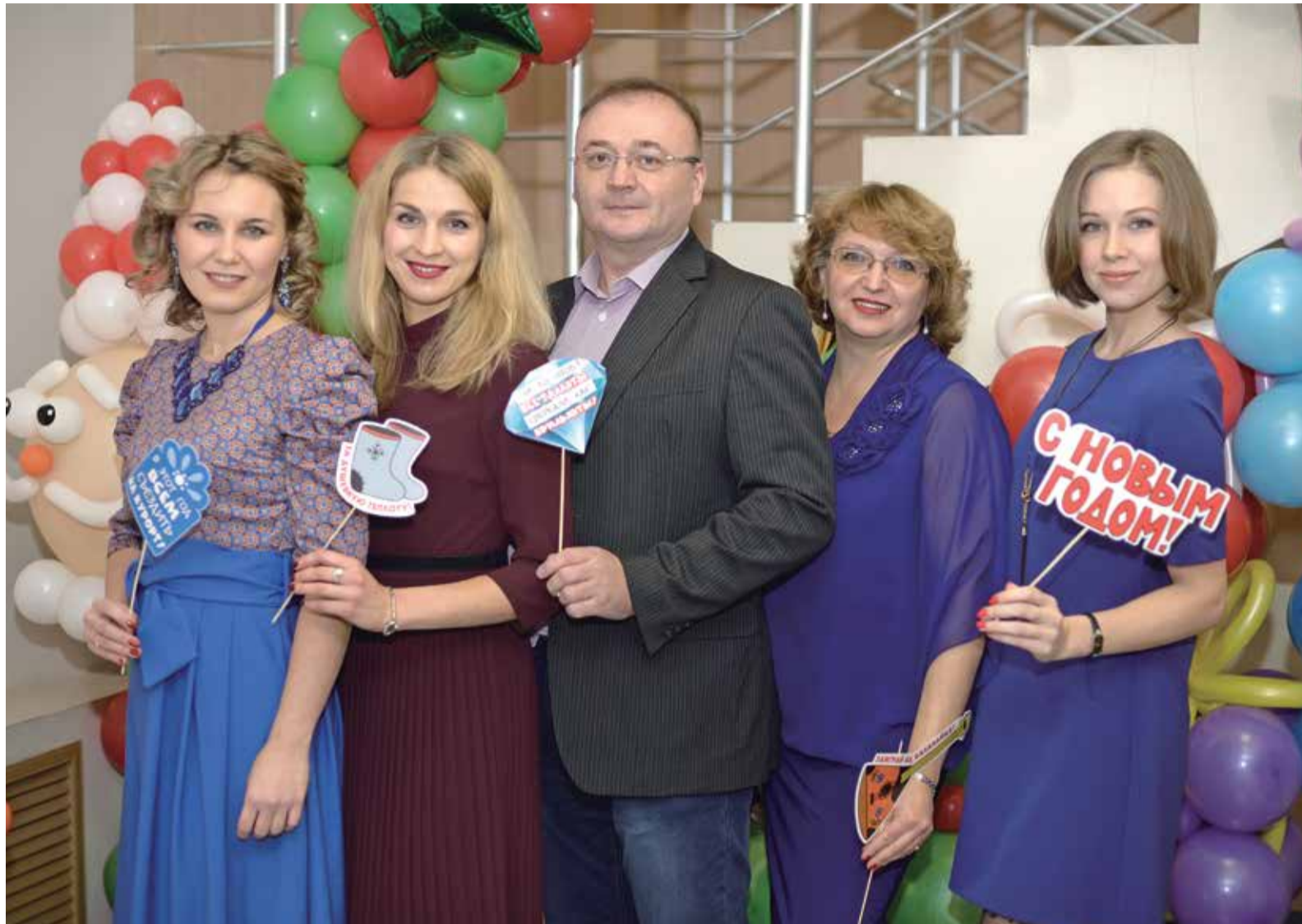
Отдел кадров и социального развития Оренбургского гелиевого завода на новогоднем мероприятии, 2016 год

Зачастую отправная точка профессионального пути соискателя начинается с работников кадровой службы. Прежде чем занять желаемую должность в компании, каждому из нас предстояло пройти собеседование. В некотором роде данный отдел считают визитной карточкой предприятия, ведь первые впечатления о новом месте устраивающийся на работу формирует именно здесь. 24 мая все, кто причастен к работе с персоналом, отмечают свой профессиональный праздник.