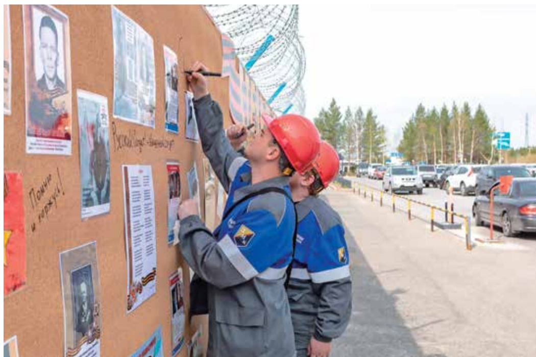
Надписи в честь 75-летия Победы на «Стене Памяти» на Сургутском ЗСК