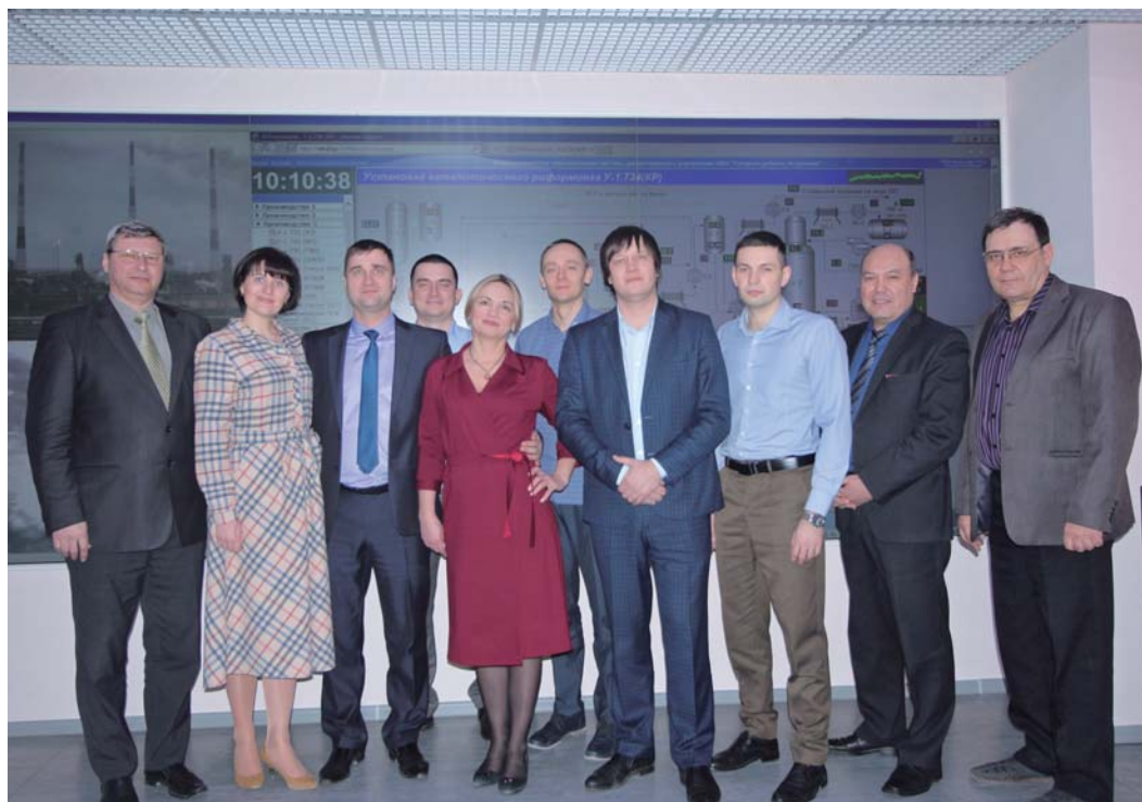
Коллектив производственно-диспетчерской службы Астраханского ГПЗ

Согласно энциклопедическому определению «диспетчер» — это должностное лицо, отвечающее за координацию каких-либо действий в определенной сфере. В буквальном переводе с английского — отправлять, отсылать. Но прежде чем выполнить свои основные действия, диспетчеру необходимо сначала собрать огромный объем информации, систематизировать его и только после этого передать в нужном направлении.