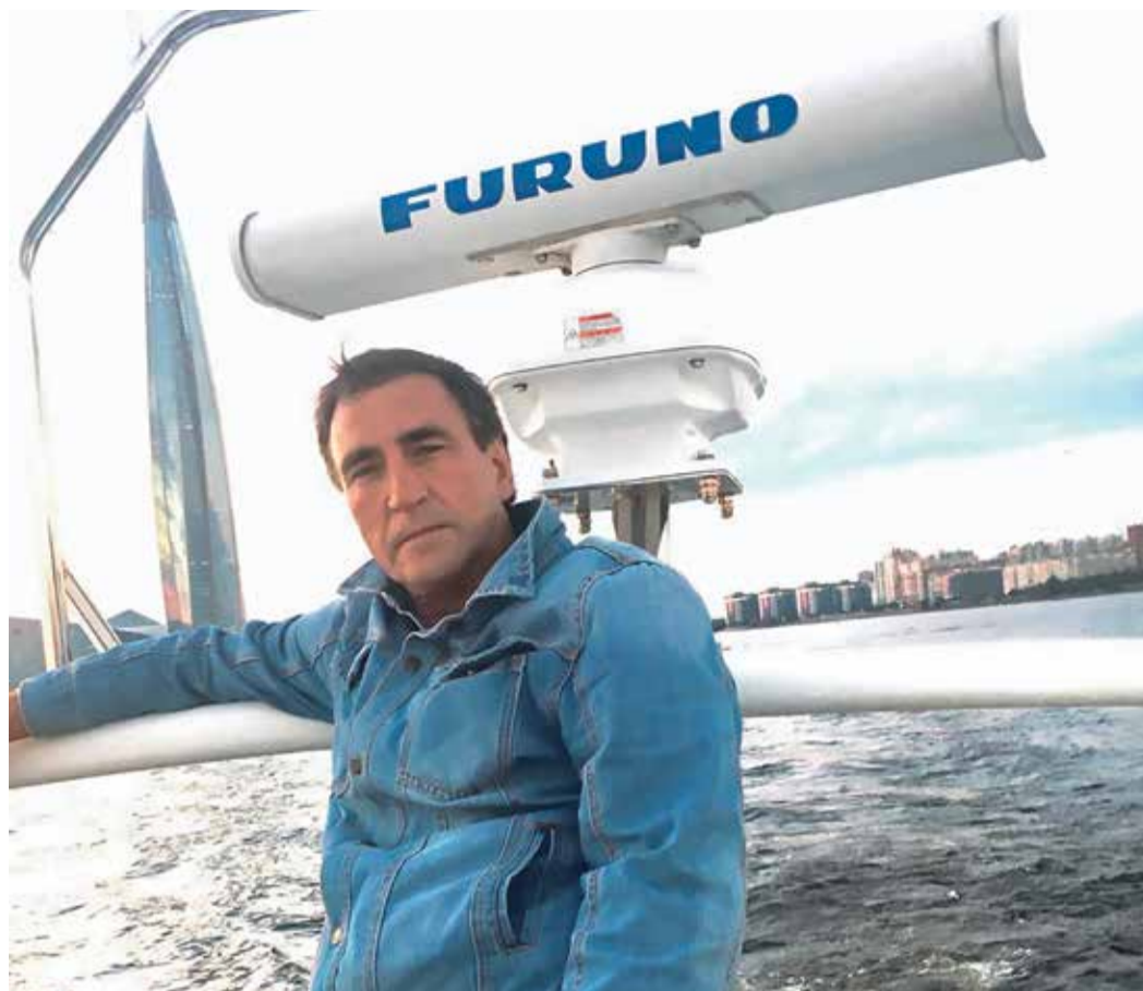
Проплывая мимо «Лакта-центра»