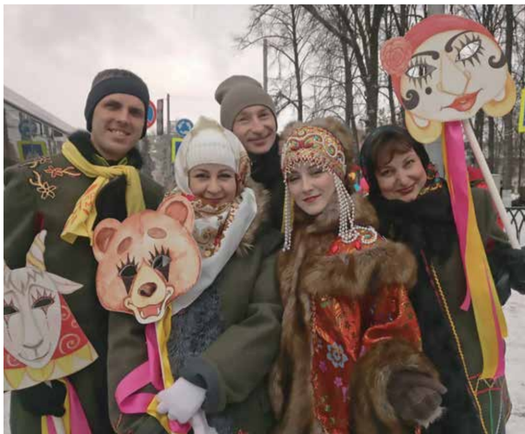
Артисты Молодежного театра на празднике «Масленица»