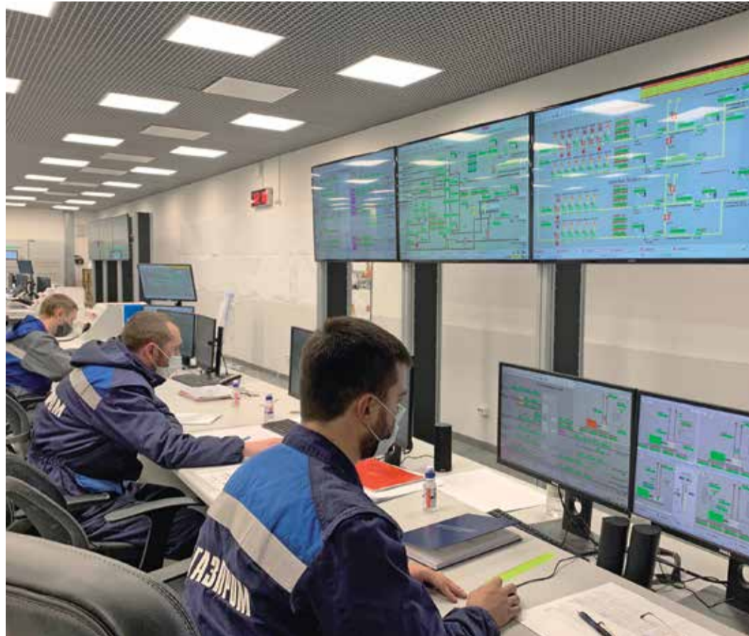
Операторная комплекса ДКС-УПГД

С 2019 года на Заводе по подготовке конденсата к транспорту производят новый вид товарной продукции — природный горючий газ. Возможность вырабатывать этот продукт напрямую связана с вводом в эксплуатацию нового технологического объекта — установки подготовки газов деэтанализации.