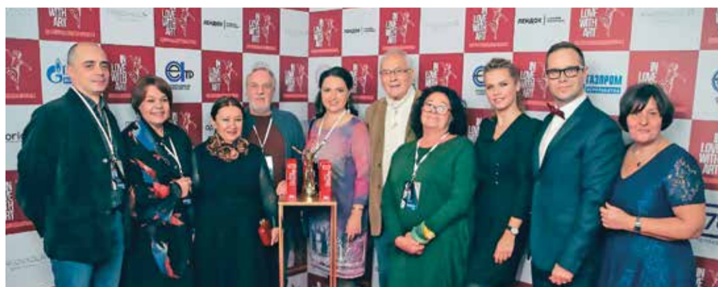
Члены жюри Международного кинофестиваля

«Конкурс был серьезным, и нам с коллегами пришлось поспорить, кто достоин