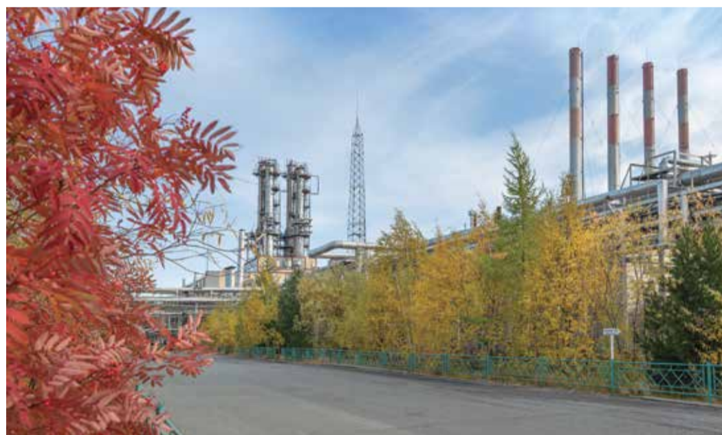
Установка стабилизации конденсата.

Перед заменой змеевиков были остановлены технологические нитки УПДТ-2, сброшено давление. Оборудование освободили от сырья и продуктов. После установки заглушек оборудование и трубопроводы пропарили. Затем начался самый ответственный этап: замена змеевиков. Для этого работники последовательно разобрали печи: сняли газовые горелки, горелочный камень, камень амбразуры и пода, футеровку технологических печей, демонтиро-