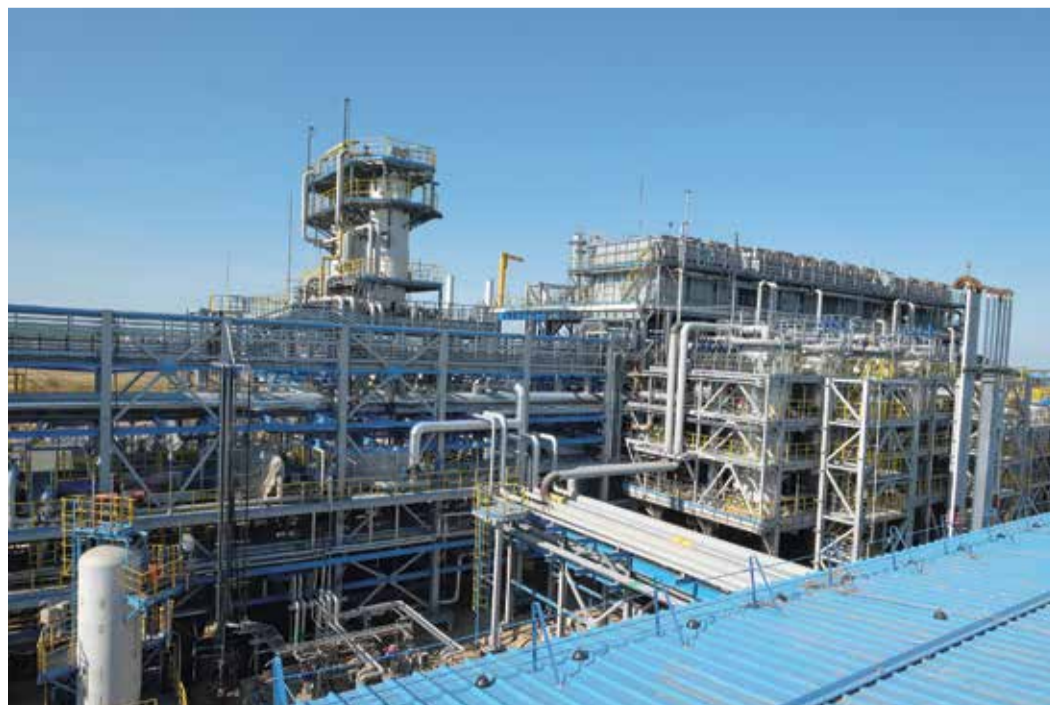
Новый перерабатывающий комплекс ДКС-УПГД