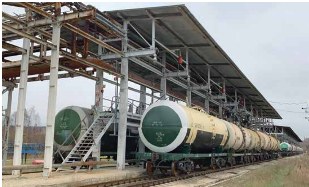
Эстакада налива сжиженного газа и стабильного конденсата. Цех № 7

Для этого подразделения Сосногорского газоперерабатывающего завода 2020 год дважды юбилейный. В июне 1970 года был введен в эксплуатацию участок отгрузки стабильного конденсата и сжиженных газов (в настоящее время цех № 7), а в 2005 году прошла масштабная реконструкция этого производства.