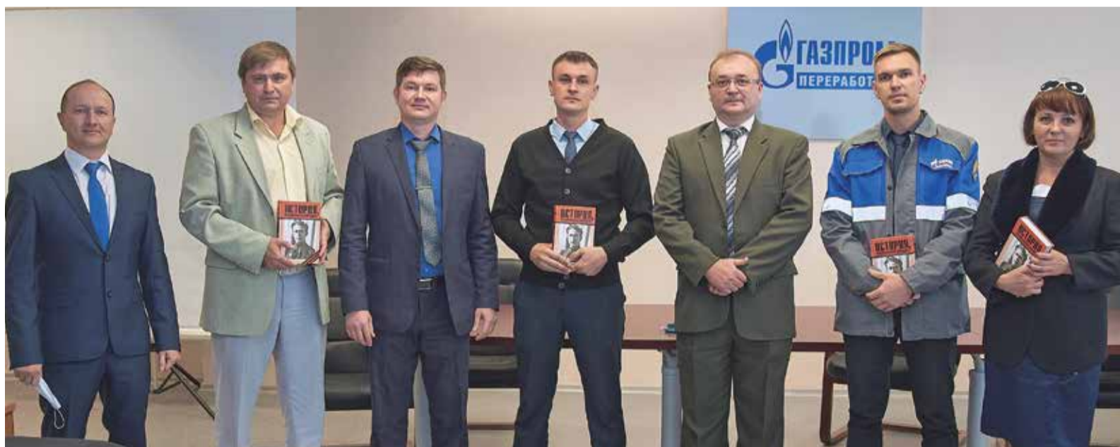
«История, рассказанная народом» вручена авторам историй – работникам Оренбургского гелиевого завода, кто рассказал о подвигах своих героев

С каждым днем события Великой Отечественной войны все дальше от нас, а значит, сегодня еще важнее сохранить подлинные истории того времени. Именно такие – живые и без прикрас – о своих предках ежегодно рассказывают работники нашего