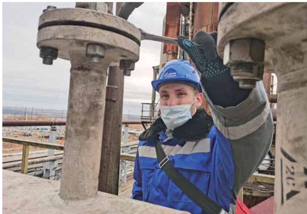
Работы по замене теплообменников на установках Оренбургского ГПЗ

в прошлом году 45-летний юбилей. В 70-е годы прошлого века мощности завода строились с расчетом на переработку до 45 миллиардов кубометров газа именно Оренбургского нефтегазоконденсатного месторождения. Тогда проектировщики и не предполагали, что вскоре завод примет на переработку газ Карачаганакского газоконденсатного месторождения, который существенно отличается по составу от оренбургского. Оба вида газа попадают в «общий котел», что создает производителям немало проблем.