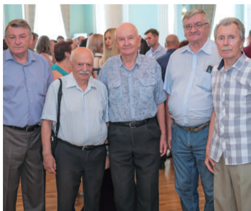
Почетными гостями на празднике газовиков стали ветераны предприятий. На фото заслуженные пенсионеры Астраханского ГПЗ.