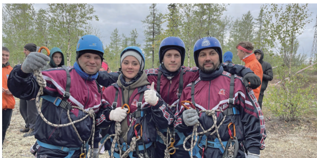
Команда Chicago Bulls, участники «Турслета ЗПКТ-2022»

Сотрудники двух филиалов компании – Астраханского газоперерабатывающего завода и Завода по подготовке конденсата к транспорту – в конце августа приняли участие в туристических слетах, проходящих в своих регионах.