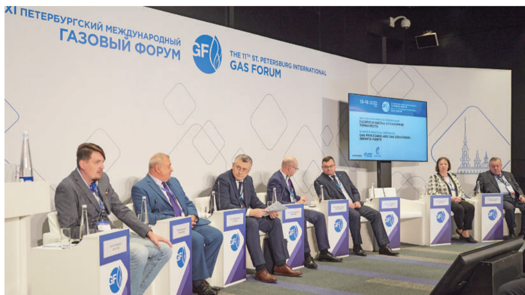
Докладчики конференции «Газопереработка и газохимия: точки роста»

В Северной столице состоялся XI Петербургский международный газовый форум (ПМГФ-2022). За четыре дня в павильонах «Экспофорума» прошло более 70 сессий, конференций, круглых столов и деловых игр. Мероприятия посетили 13 тысяч человек из разных регионов России и 22 стран мира. Профессиональные встречи были особенно важны в условиях новых вызовов и глобальных изменений на сырьевых рынках.