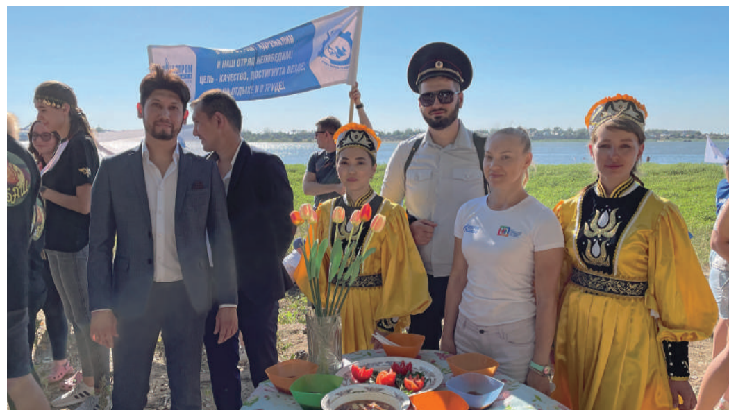
Астраханские коллеги примерили на себя образы калмыцкого народа.