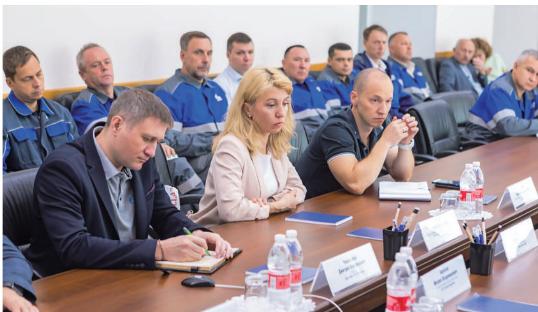
Участники итогового совещания на Сургутском ЗСК

В конце августа в трех филиалах компании «Газпром переработка» прошли внеплановые аудиты по производственной безопасности. На Сургутском заводе по стабилизации конденсата, Заводе по подготовке конденсата к транспорту и в Управлении по транспортировке жидких углеводородов проверили соответствие производственной деятельности установленным требованиям ПАО «Газпром».