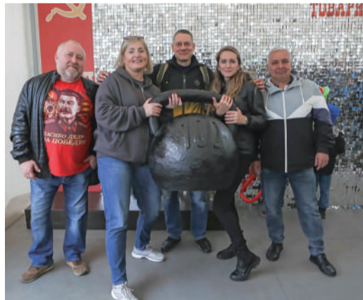
Сотрудники Сургутского ЗСК отметили профессиональный праздник по-семейному. Они приняли участие в тематическом мероприятии, основной идеей которого стало возвращение во времена СССР.