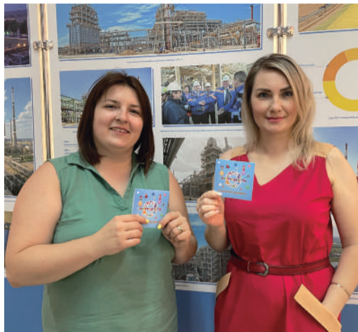
Сертификаты для родителей первоклассников Астраханского ГПЗ