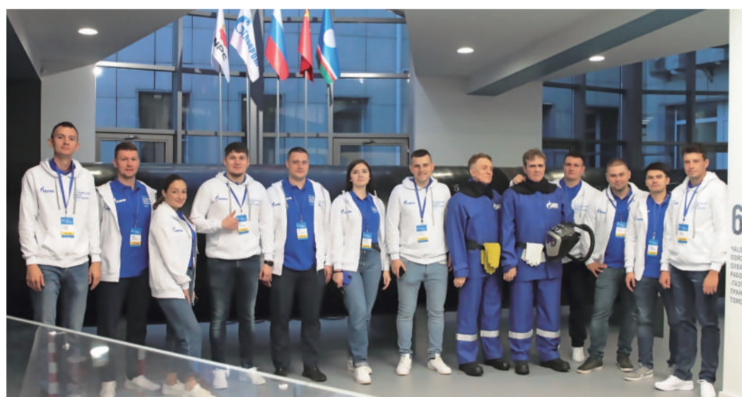
Участники конкурса «Лучший молодой работник Группы «Газпром»