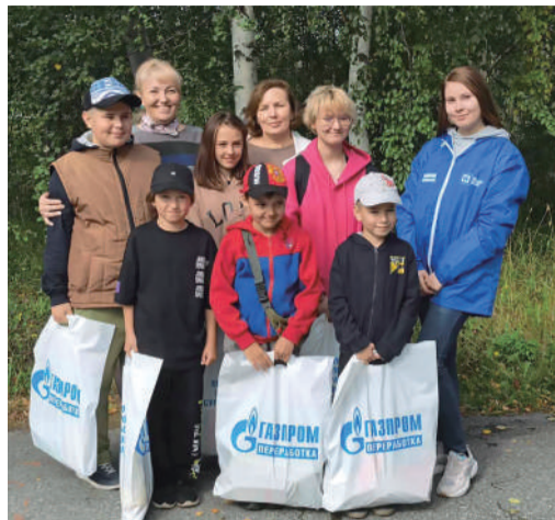
Акция прошла на Сургутском ЗСК

Молодые газовики Завода по стабилизации конденсата им. В. С. Черномырдина традиционно помогли семьям и детям в трудной жизненной ситуации, проживающим в Сургутском районе. Ребятам из поселка Солнечного передано 15 наборов со школьными принадлежностями.