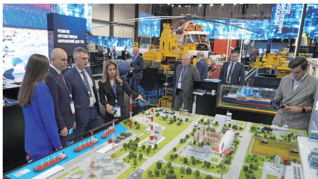
На стенде компании «Газпром переработка»

На конференции «Глубокая переработка газа в новых экономических реалиях» руководители ведущих компаний и научно-исследовательских центров в сфере переработки газа обсудили новые технологии, перспективную продукцию с высокой добавленной стоимостью, которую можно получить благодаря переработке, а также рынки сбыта. Технологические решения обсудили на примере строящегося Астраханского комплекса по производству полимеров – совместного проекта предприятия «Каспийская инновационная компания» и «Газпром переработки».