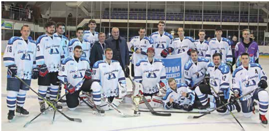
Сборная «Газпром переработки»

В борьбе за третье место «Газпром переработка» провела второй матч