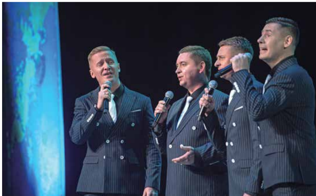
Мужская вокальная группа «М-Квартет» Оренбургского ГПЗ