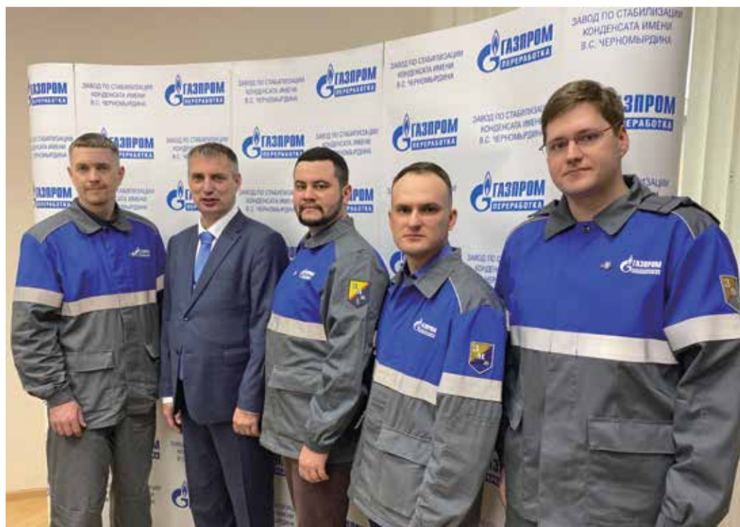
Участники награждения памятным знаком