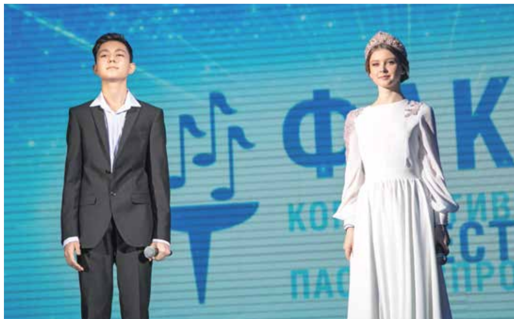
Дуэт «1 + 1» – лауреат III степени