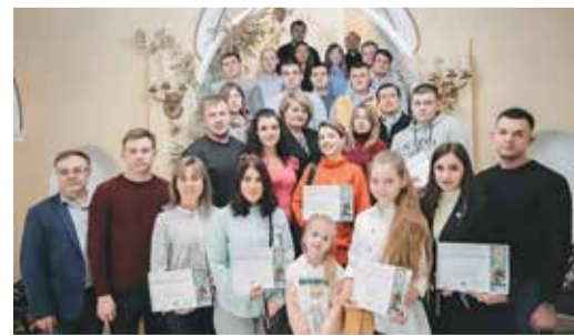
Участники акции в Оренбурге