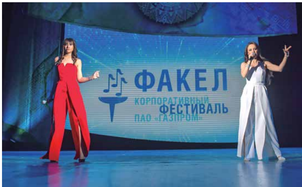
Дуэт ANNA – лауреаты III степени