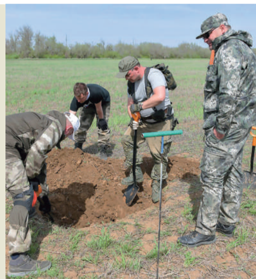
Поисковые работы клуба «Виктория»