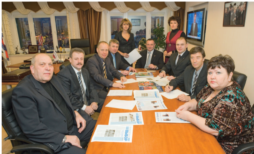
Заседание профсоюзного комитета. 2008 год

Было непросто... У нас сложилась организация из больших подразделений в трех регионах России. Надо было создать коллектив, это было первоочередной задачей. Хорошо, что был такой фундамент, как Генеральный коллективный договор «Газпрома». Он стал основой для тех положений, которые верстались уже непосредственно в «Газпром переработке».