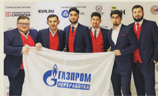
Команда КВН Астраханского ГПЗ «Сердце Каспия»

На несколько дней в году актовый зал Сургутского ЗСК менялся до неузнаваемости. Здесь устанавливали светодиодный экран