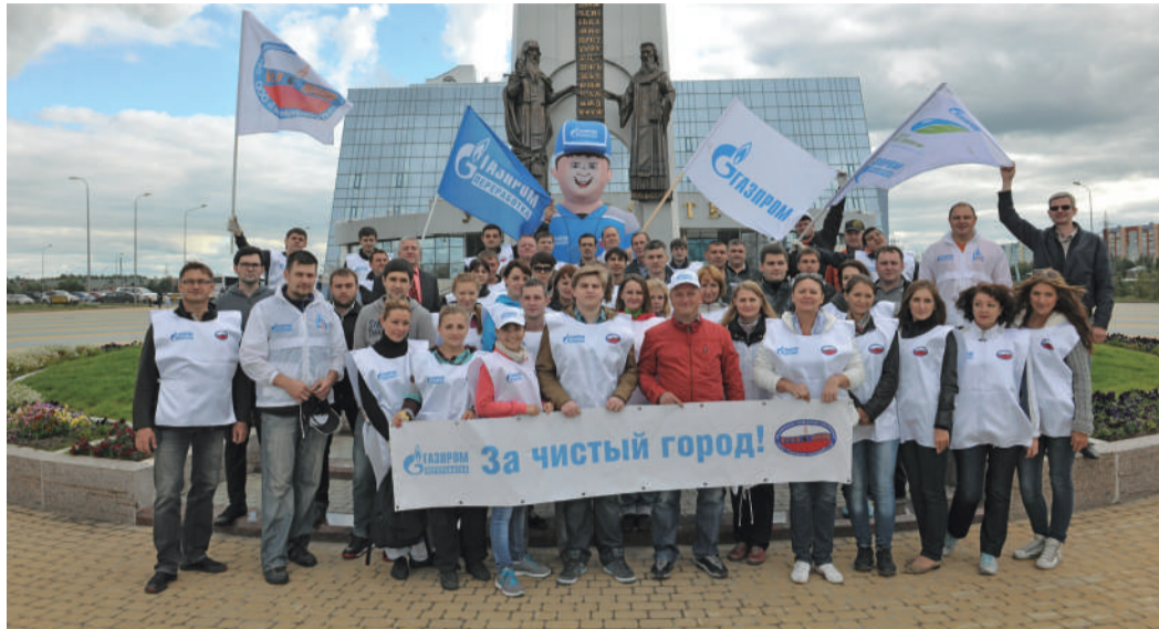
Участники экологической акции в Сургуте