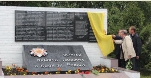
Открытие обелиска в Сосногорском районе