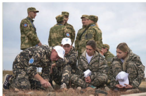
Военно-спортивный фестиваль «PROверь себя»