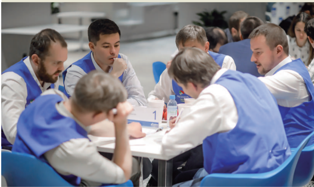
Чемпионат по интеллектуальным играм «Газпром переработки»

прошло при поддержке первичной профсоюзной организации. В Санкт-Петербург приехали сотрудники всех филиалов компании. В ходе сессии молодые работники сгенерировали более тысячи идей для создания будущих проектов по пяти направлениям работы с молодежью: наука, спорт, общественная, патриотически направленная и социально-культурная деятельность. Все участники форума были вовлечены в тренинги и практикумы на тему работы в команде, лидерства, а также умения находить решения сложных вопросов и видеть возможности для самореализации в компании.