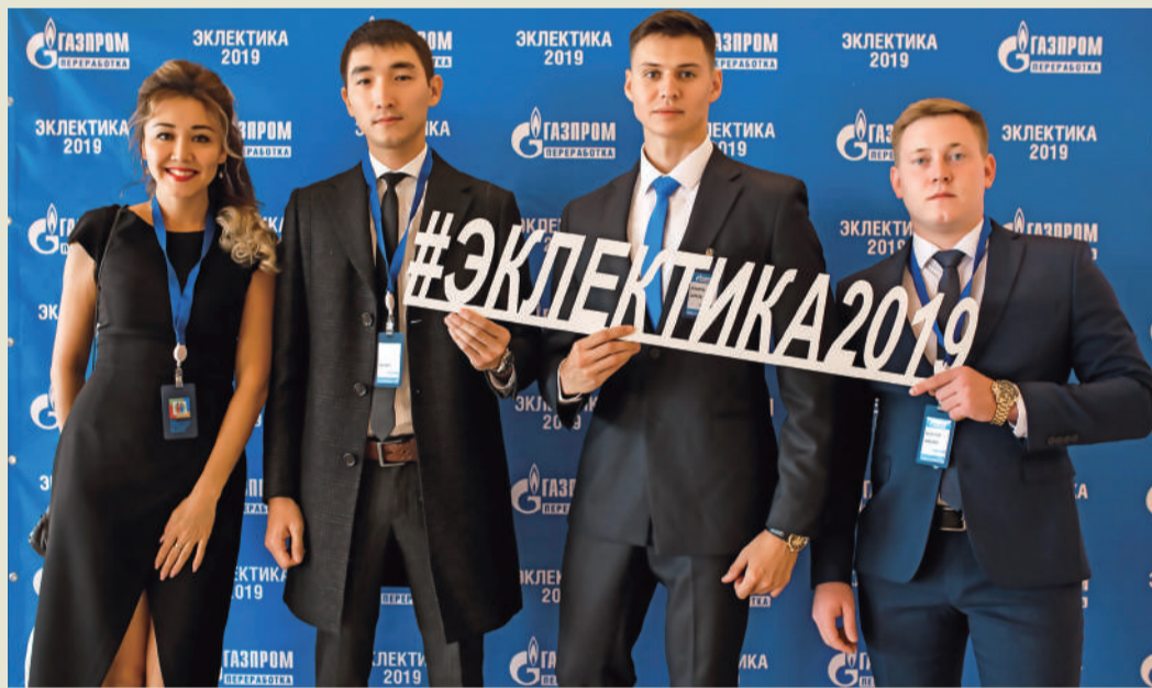
Участники первой форсайт-сессии