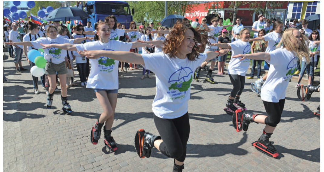
Молодые работники Сургутского ЗСК