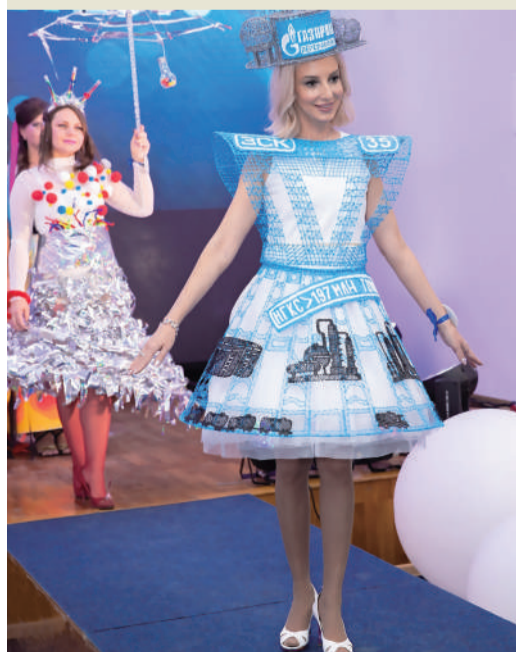
«Заводчанка» Сургутского ЗСК