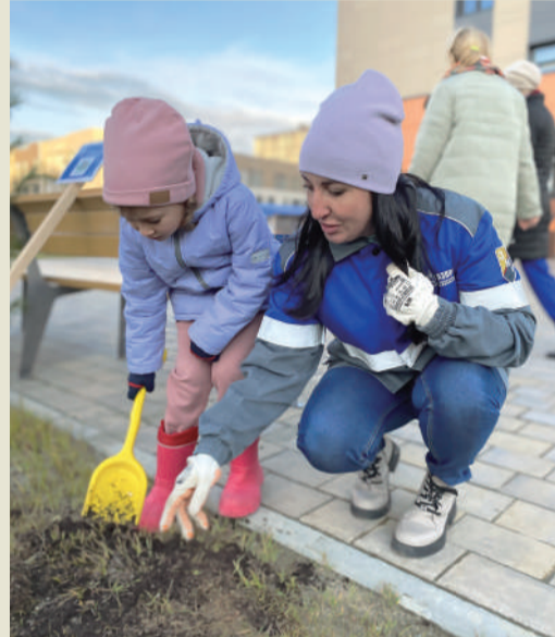
Экологическая акция на ЗПКТ