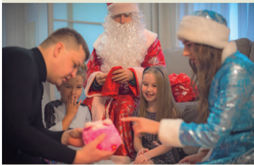
Экскурсия к газоспасателям Сосногорского ГПЗ

Не первый год для детей работников Сосногорского ГПЗ свои двери открывает пожарная часть завода, здесь ребятам подробно рассказывают о работе газоспасателей, а также дают примерить костюм пожарных на себя. Во всех филиалах компании сотрудники вместе с семьями участвуют в конкурсе «Мама, папа, я – спортивная семья». А самым популярным конкурсом среди филиалов считается конкурс рисунков. Так, например, в этом году на ЗПКТ состоялась целая выставка детских работ.