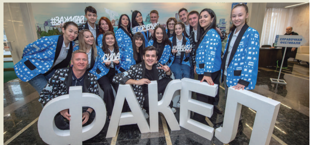
Участники фестиваля «Факел» в 2022 году