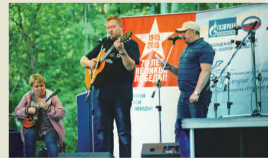
Фестиваль бардовской песни в Сургуте