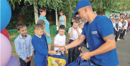
Оренбургские газовики с учениками школы-интерната

При поддержке ОППО «Газпром переработка профсоюз», а также первичных профсоюзных организаций филиалов в городах присутствия компании проходят благотворительные акции. В Сургуте и Сосногорске установили регулярную опеку над воспитанниками социальных центров. Традиционной для всех регионов стала акция «Соберем ребенка в школу», во время которой газовики дарят наборы для учебы первоклассникам. ППО Сургутского ЗСК, ОГПЗ и ОГЗ поддерживают ветеранов и людей с ограниченными возможностями. На Сосногорском ГПЗ проводят акцию помощи бездомным животным.