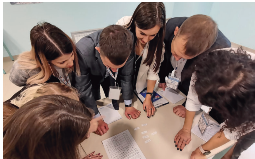
На тренинге по личной эффективности