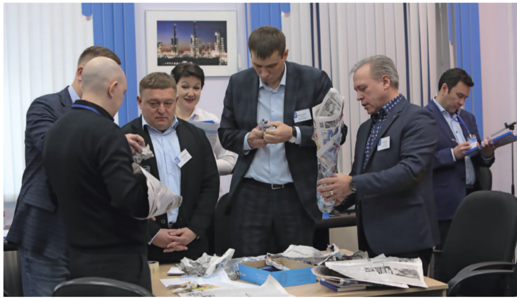
Работа в команде

В начале декабря на Заводе по стабилизации конденсата прошло мероприятие «Центр развития», где оценивались управленческие и личностно-деловые компетенции участников кадрового резерва на замещение должностей главного инженера и заместителя руководителя филиала.