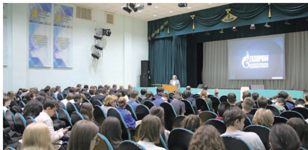
«День компании» собрал более 100 студентов