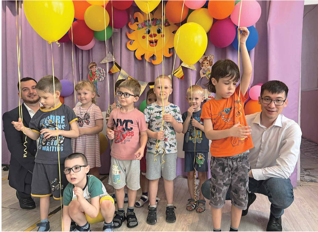
Поздравление воспитанников структурного подразделения первого Астраханского губернского техникума

Международный день защиты детей отмечается более семидесяти лет. В каждой стране есть свои многолетние традиции празднования. В России в этот день проводятся спортивные и культурные мероприятия, фестивали и концерты, благотворительные акции. Сотрудники компании «Газпром переработка» поздравили детей в Санкт-Петербурге, Астрахани и Сосногорске.