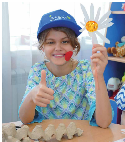
Мастер-класс в Астрахани

Волонтеры Оренбургского гелиевого завода на экологическую акцию решили приехать на самом экологически чистом транспорте – на велосипедах. То есть и для природы хорошо, и для здоровья полезно. Субботник про-