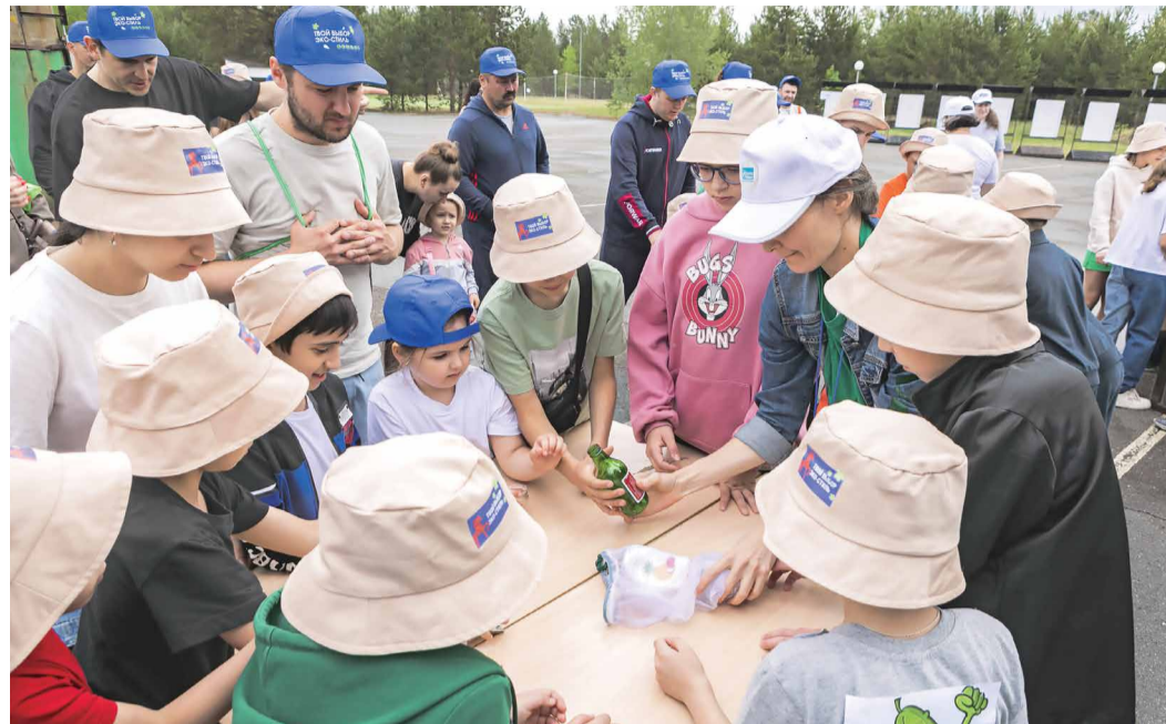
В Сургуте рассказали ребятам о правилах сортировки мусора

«Мы провели прекрасный и познавательный семейный экодень! Дети хорошо усвои-