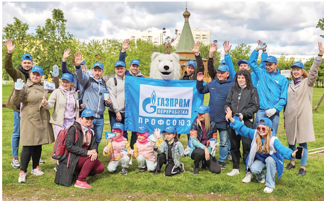
Участники экологической акции в Санкт-Петербурге

Накануне Всемирного дня окружающей среды в компании «Газпром переработка» провели масштабную экологическую акцию, участниками которой стали более 500 человек из всех регионов присутствия предприятия. Экологический флешмоб «Твой выбор — эко-стиль!» объединил газофиков, их родных и близких в едином желании сделать нашу планету чище и лучше. Навести порядок в парках и скверах, высадить деревья, провести экологические уроки, устроить велопробег и многое другое успели в этот день сотрудники компании.