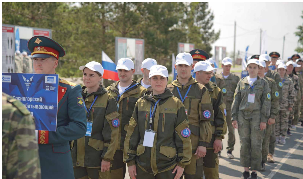
Построение на плацу