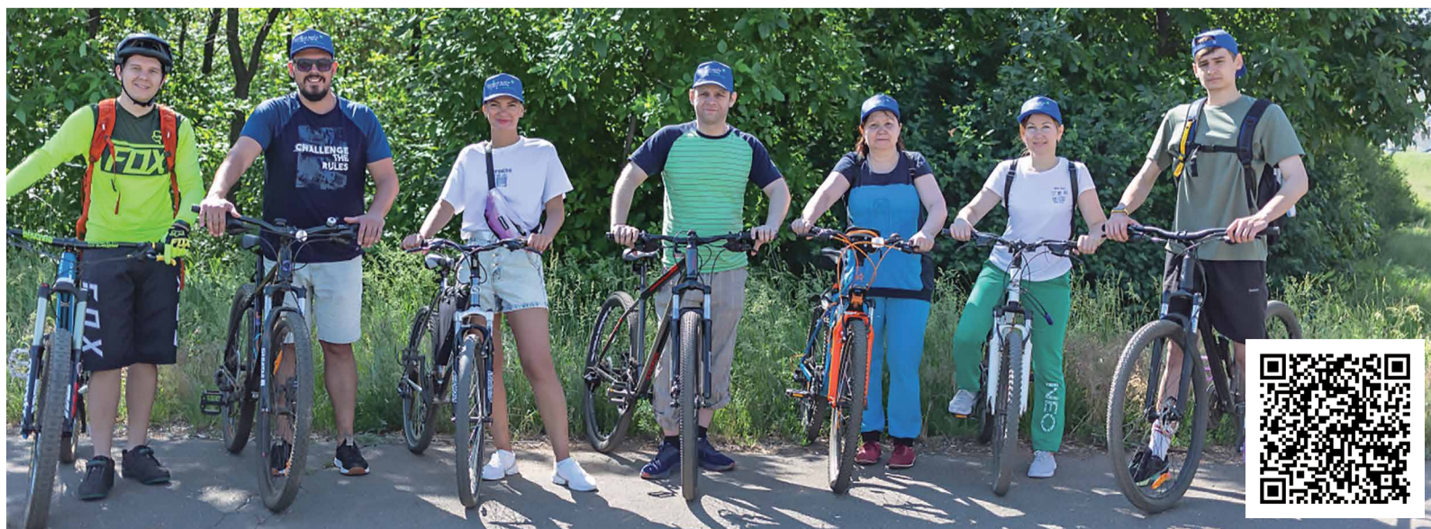
Сотрудники Оренбургского гелиевого завода приехали на субботник на велосипедах