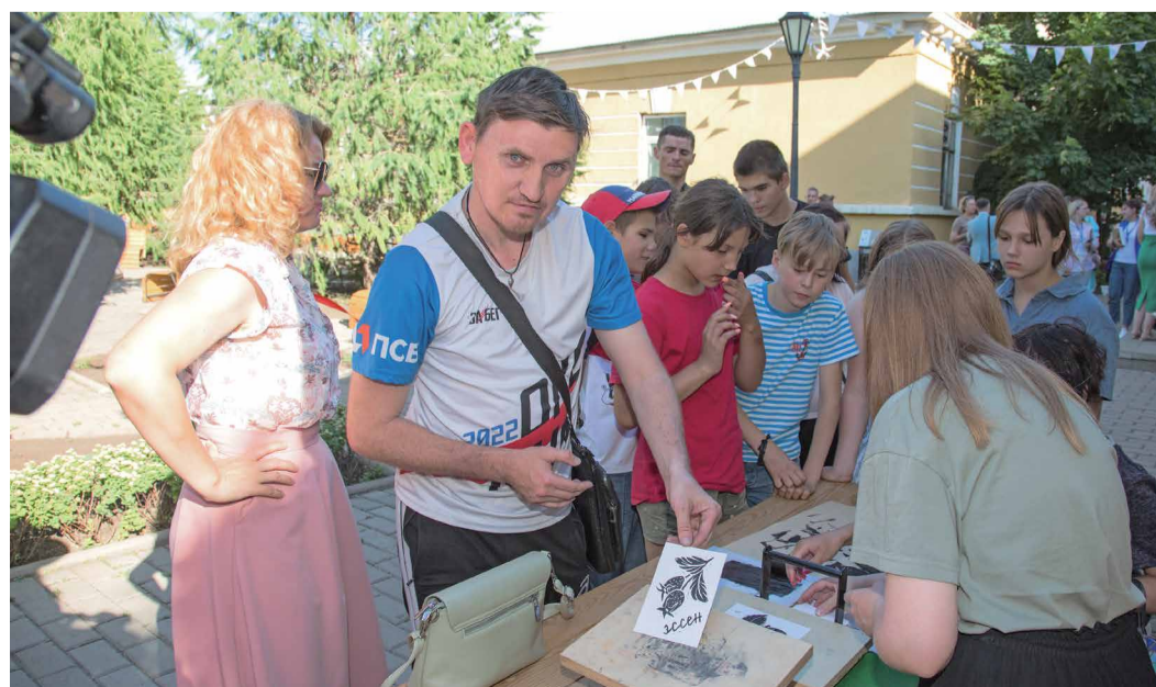
Оренбуржцы с удовольствием принимают участие в мероприятиях, которые проходят в музейном дворике «Эссен»