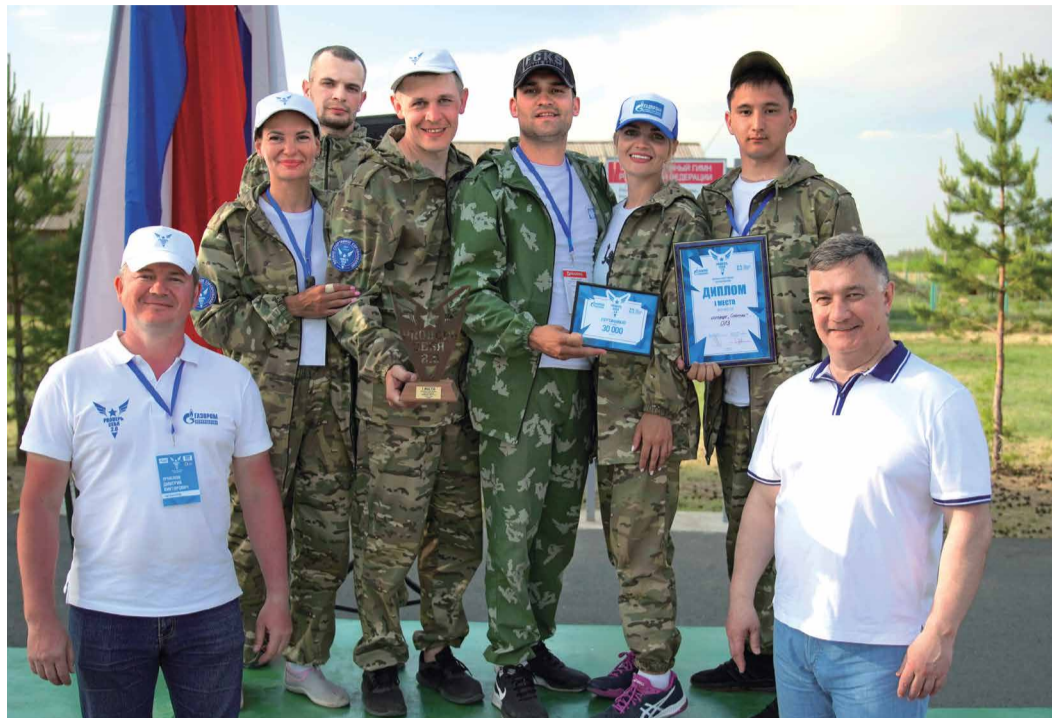
Победители соревнований – команда «Спарта»

В Оренбурге во второй раз состоялся военно-спортивный фестиваль «ПРОверь себя». Соревнования, организатором которых выступает гелиевый завод, прошли с 25 по 27 мая на территории одного из военных полигонов региона.