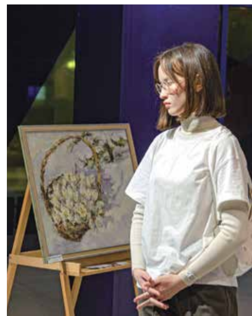
Гости кинопоказа на выставке

Внимание! Принимая участие в конкурсе, вы соглашаетесь с публикацией фотографий в социальных сетях, а также на страницах корпоративной газеты.