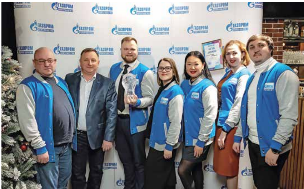
Победитель чемпионата во внутреннем зачете – «Культурная сборная»