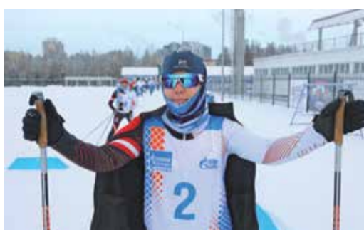
На старт! Внимание! Марш!

Состязания спартакиады проходили на трех площадках, каждая стала местом напряженной борьбы за очки в турнирной таблице. На старт вышли лыжники, стрелки, теннисисты, футболисты и баскетболисты. Параллельно