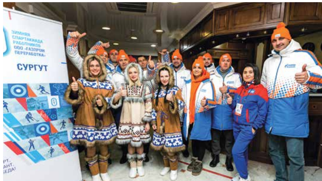
Встреча команды «Восток» на сургутской земле

С первого дня все соревнования спартакиады, а также жизнь за пределами спортивных площадок освещались не только в социальных сетях компании и на интернет-портале, но и в мобильном приложении ГИД. Прямые эфиры, которые велись в ГИД, позволили спортсменам впоследствии провести ана-