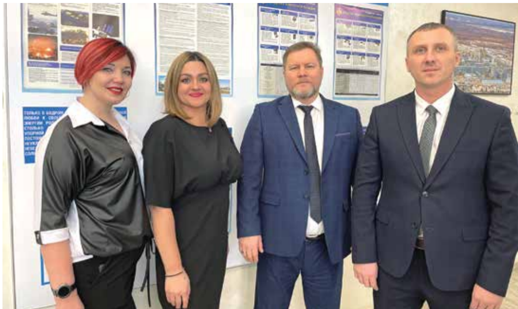
Коллектив отдела по делам гражданской обороны и чрезвычайным ситуациям, воинскому учету ЗПКТ

В Ямало-Ненецком автономном округе подвели итоги смотра-конкурса по гражданской обороне на звание «Лучший руководитель органа, уполномоченного на решение задач в области гражданской обороны объекта экономики ЯНАО».