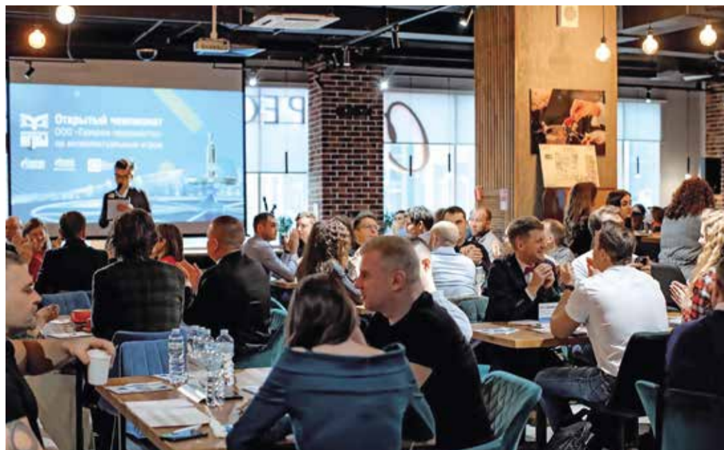
Чемпионат собрал 230 работников Группы «Газпром»