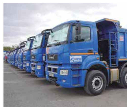
Специальная техника транспортного цеха