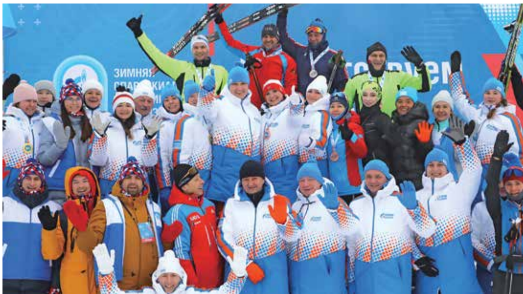
Награждение победителей лыжных гонок

С 20 по 23 ноября в Сургуте прошла зимняя спартакиада «Газпром переработки». Участие в ней приняли более 120 спортсменов из семи городов Российской Федерации, которые представили команды «Север», «Восток» и «Центр».