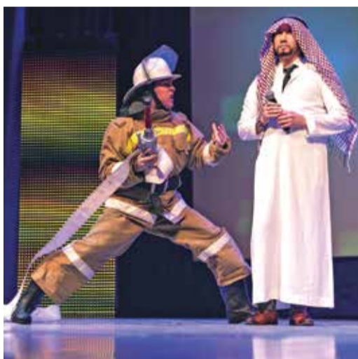
Выступление команды «Производство 5»

Команда «Производство 5» удивила зрителей перевоплощениями: ребята выходили в образе генерального шейха ООО «Газпром переработки Дубай» и в образе певца Шамана. Коллеги из Санкт-Петербурга подчеркнули местный колорит. «Профсоюзовцы» практически выбрали нового лидера, а в своей песне затронули самые обсуждаемые темы. Оренбуржцы талантливо исполнили музыкальные композиции и предложили сценарий корпоративного вечера. Ну а де-